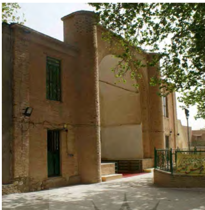
تصویر ۶. نمای ایوان ورودی امامزاده حمزه (خانی‌پور، ۱۳۹۴).