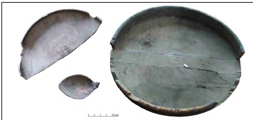
تصویر ۱۲. ظروف چوبی به دست آمده از غار کان‌گوهر (خانی‌پور، ۱۳۹۴).