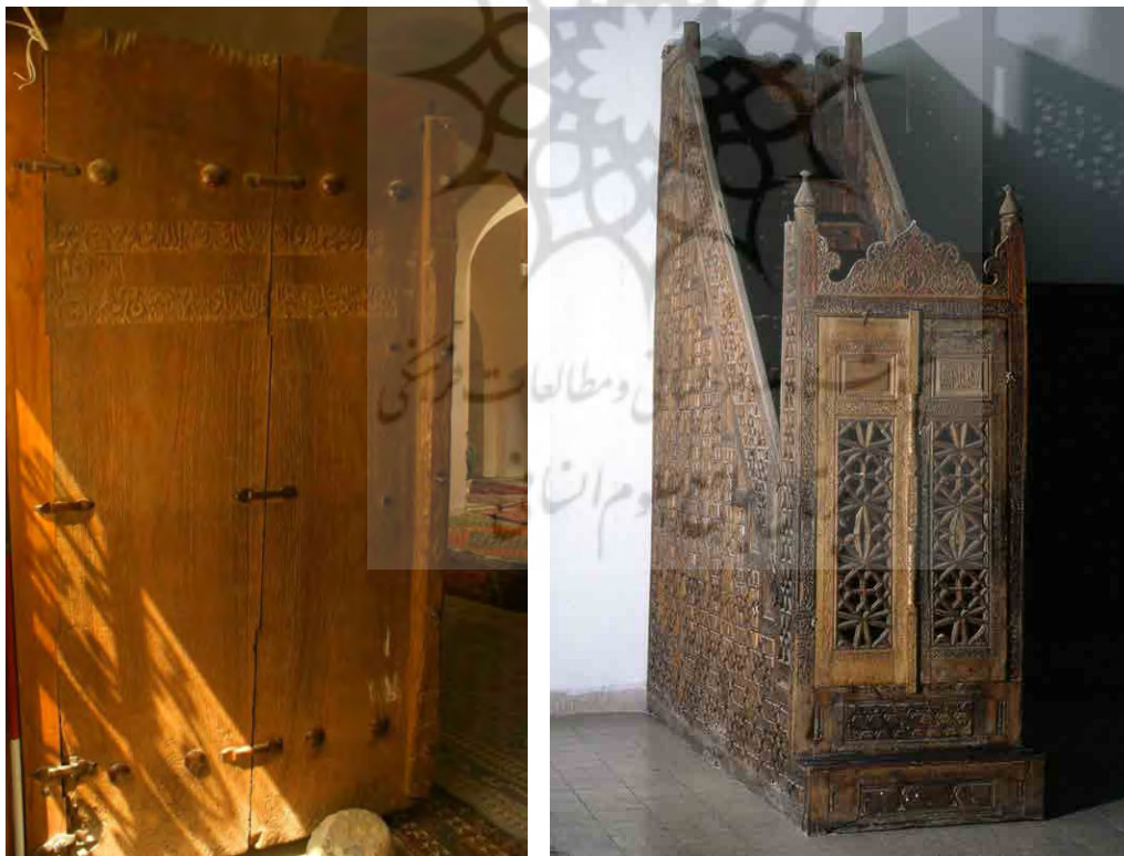
تصویر ۳. منبر چوبی مسجد جامع با تاریخ ۷۷۱ ه.ق.