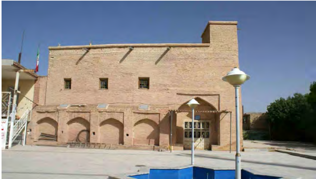
تصویر ۱. نمای شرقی مسجد جامع (خانی‌پور، ۱۳۹۴). Fig. 1. Eastern view of Jame Mosque (Khanipour, 2015).