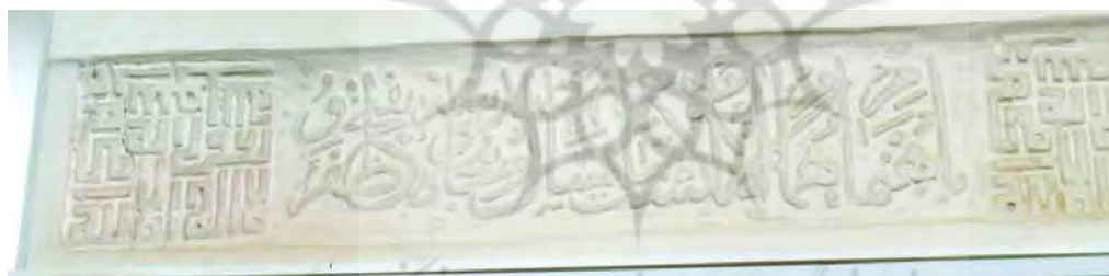
تصویر ۷. کتیبه‌ای که در آن سال ساخت بنای امامزاده به تاریخ ۹۵۳ ذکر شده (خانی‌پور و همکاران، ۱۴۰۰: تصویر ۱۱).