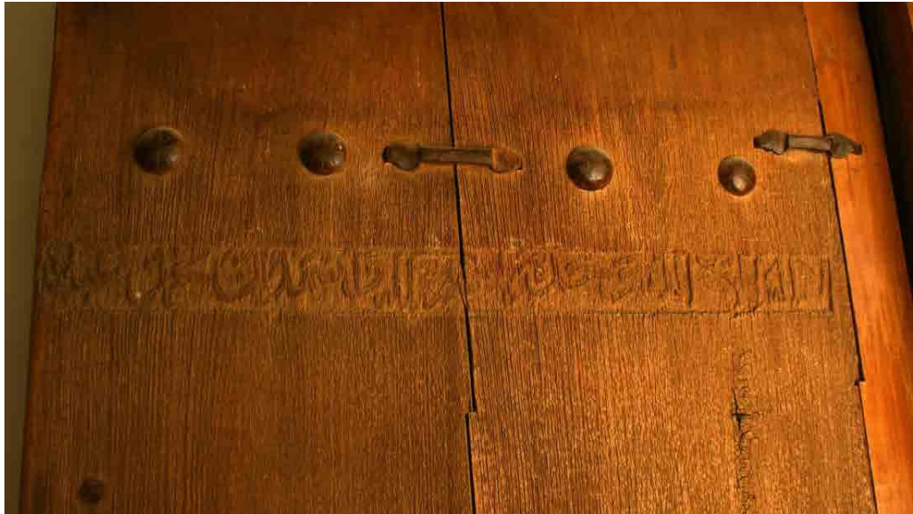
تصویر ۵. کتیبه درب سمت راست با متن شهادتین (خانی‌پور، ۱۳۹۴).