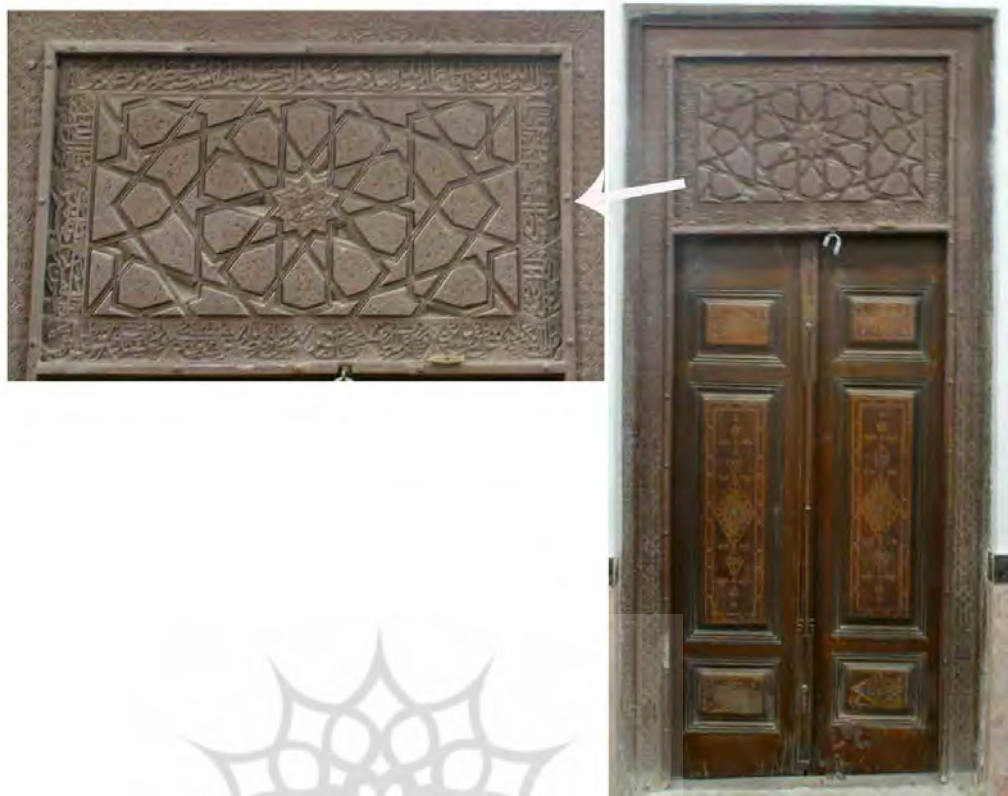
تصویر ۱۱. در چوبی امامزاده حمزه بزم (خانی‌پور، ۱۳۹۴).