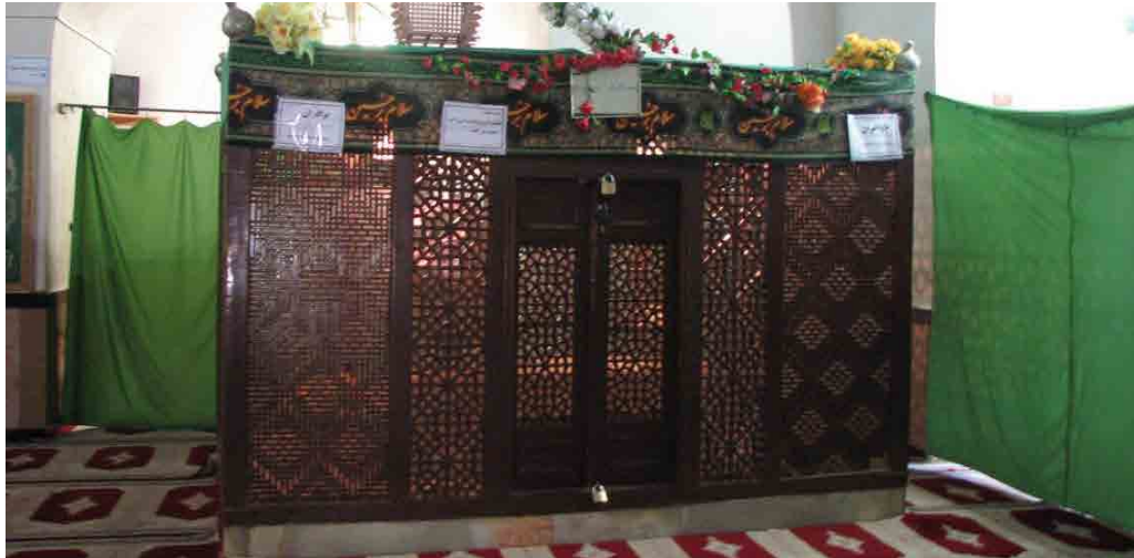
تصویر ۹. محجر چوبی امامزاده حمزه.