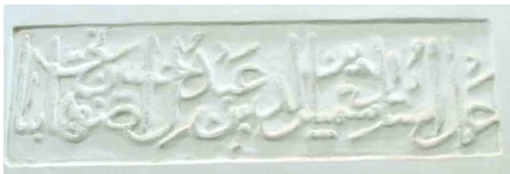
تصویر ۸. کتیبه‌ای که در آن نام استاد سازنده بنا نوشته شده (خانی‌پور، ۱۳۹۴).