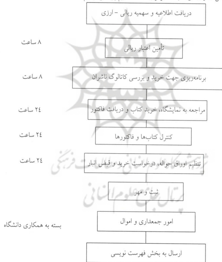
نمودار شماره ۱ - جریان کار بخش مجموعه‌سازی

در مورد بررسی بهره‌وری کتاب‌های خریداری شده از نمایشگاه بین‌المللی کتاب، رسم نمودار، جریان کار ۱ ضروریست. نمودار مذکور براساس فعالیت‌های کتابخانه مرکزی دانشگاه علوم پزشکی ترسیم شده است.