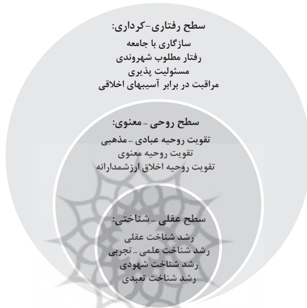
شکل ۲. الگوی مفهومی دلالت‌های برنامه‌های تربیت اخلاقی دانش‌آموزان برای زندگی آینده

در پاسخ به سؤال سوم می‌توان گفت که الگوی دلالت‌های برنامه‌های تربیت اخلاقی دانش‌آموزان برای زندگی آینده مشتمل بر مقوله‌های رفتار مطلوب شهروندی، سازگاری با جامعه، مسئولیت‌پذیری و مراقبت در برابر آسیب‌های اخلاقی بوده است که نتیجه کدگذاریهای محوری و سنتز پژوهی سطح تعالی رفتاری - کرداری است که در جدول شماره ۵ نشان داده شده است.