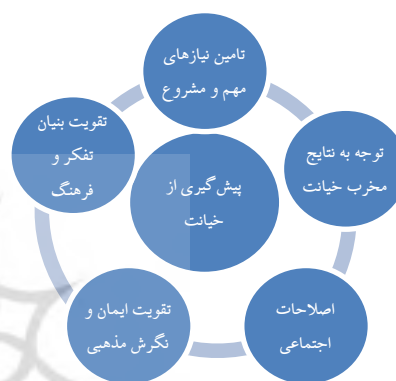
مدل مفهومی خیانت اینترنتی از منظر اسلام

و بزرگی است که بسیاری از ما از انجام آنان به‌خاطر نسیان و اشتغالات رومزه خویش ناآگاهییم؛ چراکه در روایات اسلامی آمده است که اگر حتی یکی از زوجین در زندگی مشترک خویش به استعمال بیش از اندازه عطر بپردازد و پس از آن از خانه خارج شود و استشمام این عطر را در معرض حس بویایی افراد نامحرم و عابران قرار دهد، او به همسر خویش خیانت کرده است. بنابراین خیانت از کوچک‌ترین کارها که شاید در نظر عده‌ای خطا و خیانت محسوب نمی‌گردد، آغاز می‌شود و تا رسیدن به اوج خود ادامه می‌یابد.