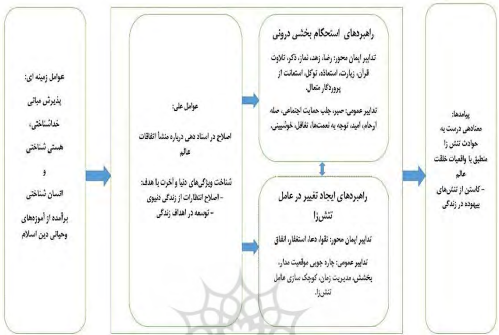
شکل ۱: الگوی نظری «مقابله با تنیدگی براساس منابع اسلامی»