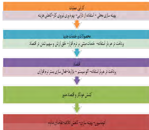
شکل ۱: تولید اجتماعی و طراحی باز (انتظارات توسعه کوتاه مدت و بلند مدت) [۱۲ و ۱۳]

در شکل شماره ۱ و براساس مقاله [۱۲ و ۱۳] انتظارات توسعه کوتاه مدت و بلندمدت برای مفاهیم تولید اجتماعی و طراحی باز ذکر شده است.