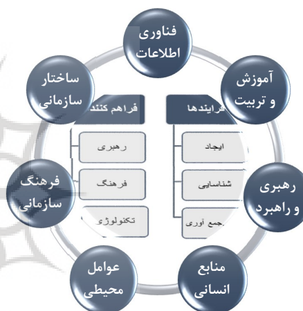
شکل ۱: مدل مفهومی تحقیق

ایده اصلی این مدل (شکل شماره ۱) از مدل ادل و گرایسون گرفته شده است. همانند مدل ادل و گرایسون، دو رکن اساسی فراهم‌کننده‌ها و فرایندهای مدیریت دانش در این مدل دیده می‌شود که با توجه به موضوع پژوهش، تمرکز اصلی بر روی فراهم‌کننده‌ها در شرکت ساختمانی هیترا خواهد بود. همچنین در قسمت فراهم‌کننده‌ها مولفه‌های ساختار سازمانی، منابع انسانی، آموزش، تحصیل و عوامل محیطی با توجه به مطالعات انجام شده و مرور ادبیات موضوعی و با توجه به شرایط شرکت ساختمانی هیترا، توسط ۱۲ نفر از خبرگان سازمان در نظر گرفته است.