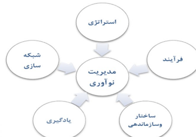
شکل ۱: مدل مفهومی پژوهش [۲۳]

پژوهش حاضر با توجه به حضور در شرکت و کسب اطلاعات از خبرگان شرکت و جمع‌آوری داده‌ها از داخل سازمان با استفاده از پرسشنامه، روش پیمایشی- توصیفی است. همچنین این تحقیق از حیث هدف، کاربردی به‌شمار می‌آید. همچنین داده‌های این پژوهش به دو روش کتابخانه‌ای و میدانی جمع‌آوری شده است و ابزار گردآوری داده‌ها و اطلاعات پرسشنامه و مصاحبه می‌باشد. مدل استفاده شده در این پژوهش، مطابق شکل شماره ۱ است.