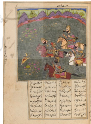
شکل ۳. (Manuscript, 1718-1721c)