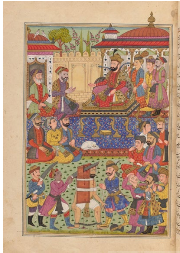
شکل ۲. (Manuscript 1718-1721b)