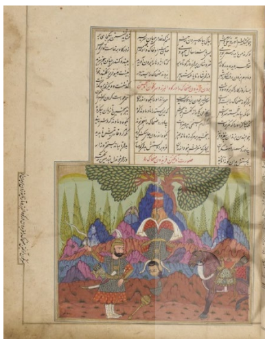
شکل ۶. (Manuscript, 1718-1721f)

شکل ۶ نام نگاره «سرنگون آویختن ضحاک در کوه البرز و تازیانه زدن بر بدون او» ست. در تصویر فریدون دیده می‌شود که در حال تازیانه‌زدن ضحاک است. ضحاک از پا به درخت تنومندی آویزان شده و دستان او نیز از پشت بسته است. او مرد جوانی است با لباس کامل و کلاه‌هی که از سر افتاده و در میان زمین و هوا معلق است. دو مار بر شانه دارد. اسبی در سمت راست تصویر دیده می‌شود که به نظر می‌رسد اسب فریدون باشد. در این نگاره تنها فریدون و ضحاک حضور دارند.