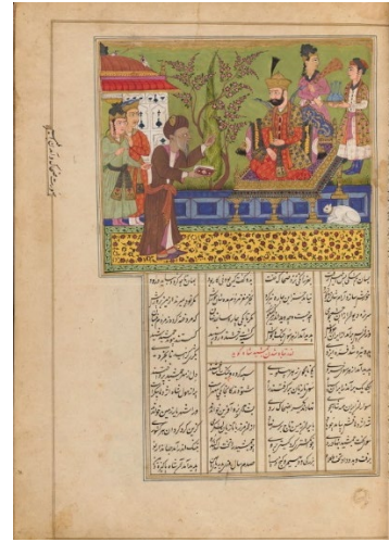
شکل ۱. (Manuscript, 1718-1721a)

شکل ۴ عنوان نگاره «شکستن فریدون طلسمات که به صورت دیو بودند» است. فریدون نشسته بر تخت، نقش شده که با گرز گاوسر خود بر سر اژدهای می‌کوبد. نیم‌تنه و سر دیوهای دیگری روی زمین افتاده‌اند و گویی پیش از این فریدون آنها را زده است. دیوی بزرگ بالای یک سر در دیده می‌شود که چهارزانو و دست‌به‌سینه نشسته و بر روی دستان او یک ظرف قرار دارد. روی سر دیو نیز سر دو سگ پشت به هم قابل‌رؤیت است. اسب فریدون بیرون دیوار تصویر شده است.