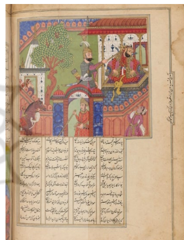
شکل ۵. (Manuscript, 1718-1721e)

عنوان شکل ۵ «آمدن فریدون از راه قلعه و زدن گرز بر سر ضحاک» است. فریدون مرد جوانی است که با تیر و شمشیر و گرز گاوسر نشان داده شده است. او گرز خود را بر سر ضحاک فرود می‌آورد که بر تخت نشسته، او نیز جوان است و دو مار بر شانه دارد با فرود آمدن ضربه بر سر او تاج و سرپند از سر او افتاده است. دو زن ناظر بر این صحنه‌اند که احتمالاً ارنواز و شهرناز باشند. فردی در درگاه ایستاده و گویی بیرون را می‌پاید. اسبی در گوشه پایین سمت چپ دیده می‌شود که احتمالاً همان اسب فریدون است.