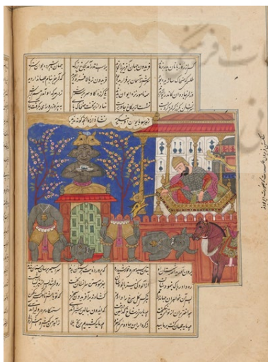
شکل ۴. (Manuscript, 1718-1721d)

شکل ۳ عنوان نگاره «به دریا انداختن اسبان فریدون» است و چهار مرد سوار بر اسب در میان دریا دیده می‌شوند که در حال تاخت و تازند. سواری که به نسبت از همه جلوتر است با شمشیری که در دست راست دارد بر سر یک اژدهای در میان آب ضربه‌ای فرود می‌آورد و چند قطره خون از سر او جاری است. در پشت دست چپ او سر گرز گاوسر دیده می‌شود. فریدون برای از بین بردن اژدهای درون آب از گرز گاوسر استفاده نمی‌کند.