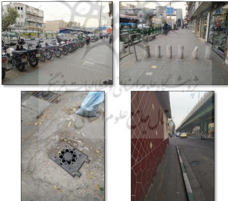
تصویر ۳. مشکلات و موانع در معابر محور مطالعاتی