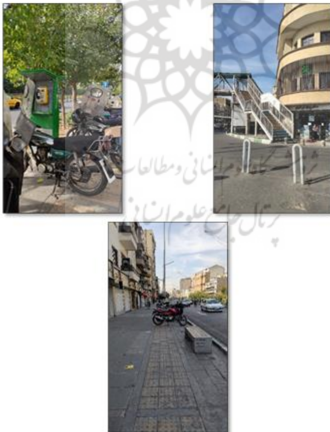
تصویر ۴. مشکلات مبلمان موجود در محور مطالعاتی

-نیمکت‌های موجود در این محور پراکنش مناسبی دارند؛ اما طراحی آنها مناسب استفاده افراد کم‌توان و توان‌یاب نمی‌باشد. از جمله مشکلات آنها، می‌توان به نداشتن جای تکیه، عدم رسیدگی به نظافت آن، عرض ناکافی و ... اشاره نمود.