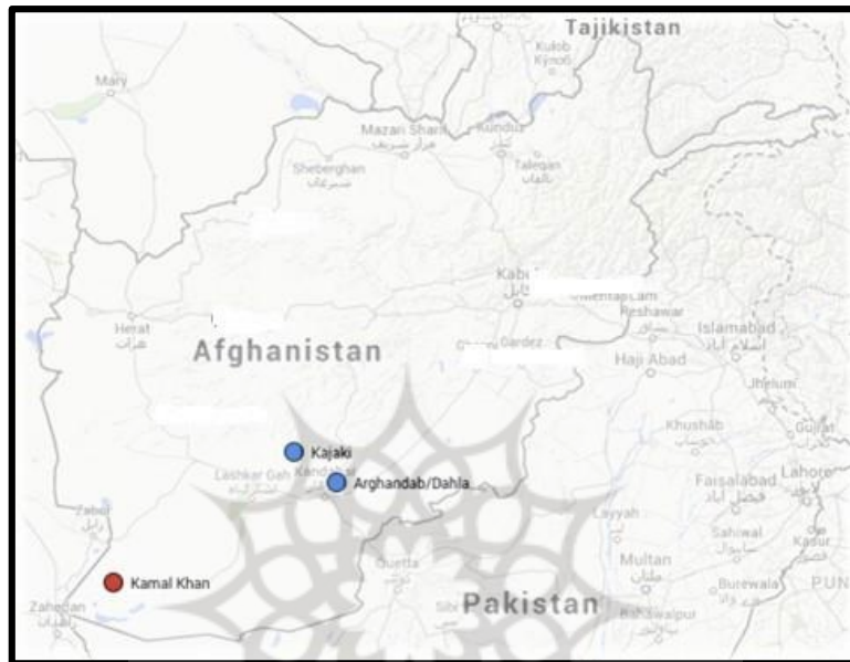
نقشه ۳: سدهای مهم ساخته شده بر روی هیرمند و سرشاخه‌های آن

آبیاری خواهد کرد [۴۲]. این سد پس از تکمیل شدن قرار است ۹ مگاوات برق تولید کند. سد کمال خان در ۴ فروردین ۱۴۰۰ تکمیل و توسط اشرف غنی، رئیس جمهور مخلوع افغانستان افتتاح شد. آقای