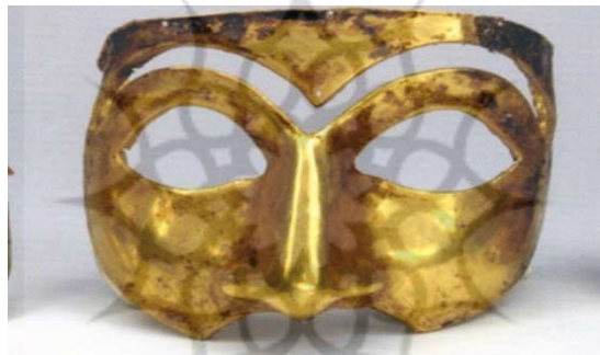
شکل ۳: بُرگ/ ماسک طلایی هخامنشیان در غار کلماکره در پل دختر. لرستان. موزه ملی ایران باستان

بررسی تحلیلی و خاستگاه‌شناسی بُرگ/ ماسک‌های نمادین در فرهنگ و... _____ محمد عارف شعبان برپا کنند». ۱۵ ارمنیان در این تاریخ از خوردن شراب پرهیز می‌کنند. بیهقی نوشته است: «امیر رضی الله عنه، روز سه شنبه، پنج روز مانده از ماه رجب، بدین کوشک نو آمد و آنجا قرار گرفت و روز دوشنبه، نهم شعبان، ... و هفت شبان روزی ... نشاط شراب می‌بود» (بیهقی، ۱۳۸۴، ص. ۶۵۳). «یکی از ویژگی‌های برجسته این جشن، برابری کامل در آن روز میان اقشار و لایه‌های جامعه و آزادی، انتقاد از بزرگان و توانگران بود. در روز باریگندان، معمولاً سفره شام رنگین‌تر و مفصل‌تر از شب‌های عادی است. از جمله عادات دیگر این روز، استفاده از نقاب و برگزاری شب‌نشینی با نقاب می‌باشد» (هوویان، ۱۳۸۰، ص. ۱۶۹).