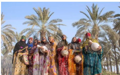
شکل ۴: زنان برکاپوش جزایر هرمز ایران

«هنر دیگر نیز هست که فقط سخن را وسیله تقلید قرار می‌دهد، به نظم یا به نثر، بدون آهنگ و اگر به نظم باشد چند نوع وزن را به هم می‌آمیزد. یا تنها از یک نوع معین پیروی می‌کند» (ارسطو، ۱۳۴۷، ص. ۴۳ به نقل از عاشورپور، ۱۳۸۹، ص. ۱۲).