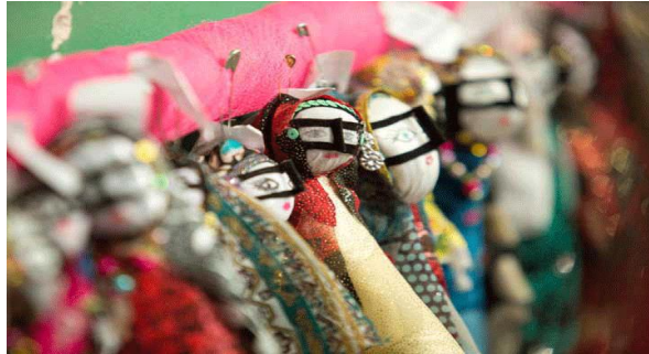
شکل ۲: بُرگه/ماسک‌های آروسک‌ها در کرانه‌های خلیج پارس