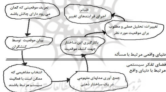
شکل ۱. الگوریتم روش‌شناسی سیستم‌های نرم [۱۲، ص ۵۰]

روش‌شناسی سیستم‌های نرم، از مجموعه پژوهش در عملیات نرم است که برای بررسی یک موقعیت مسئله‌زا یا یادگیری از آن موقعیت با بهره‌برداری از دیدگاه‌های متفاوت به کار می‌رود [۱۱]. تعریف ساختار به‌عنوان اصل و استخوان‌بندی اساسی برای یک سیستم، ضروری است. ویژگی‌های مسائل غیرساختاریافته عبارت است از: ذی‌نفعان چندگانه، دیدگاه‌های چندگانه، منافع گنگ و (یا) متناقض، عوامل نامشهود و نداشتن قطعیت. ساختاربندی مسئله راهی برای تبیین شرایط و موقعیت است. برای ساختاردهی به مسائل پیچیده که با حد بالایی از نداشتن اطمینان مواجهه‌اند، از رویکردهای سیستم نرم استفاده می‌شود. روش‌شناسی سیستم‌های نرم ۱ چکلند ۲ (۱۹۹۸) اقدام‌پژوهی است که با پژوهش درباره وضعیت مسئله، موجب یادگیری می‌شود. این رویکرد هفت مرحله به شرح شکل ۱ است