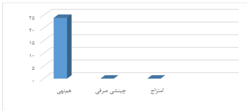
نمودار (۳) توزیع فراوانی اصطلاحات خویشاوندی در لری خرم‌آباد از نظر ساخت ملکی