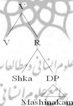
نمودار (۲) ساخت ناگذار شکستن (درمعنای خراب‌شدن)

هیل و کیسر (۲۰۱۳: ۸-۹) معتقدند که ساخت موضوعی مثال ۲۰ به صورت زیر می‌باشد که در آن فاعل نحوی که در سطح جمله تجلی می‌یابد در واقع متمم هسته R است. آن‌ها بر این باور هستند که متمم هسته R به عنوان مشخص‌گر فرافکن نمی‌شود.