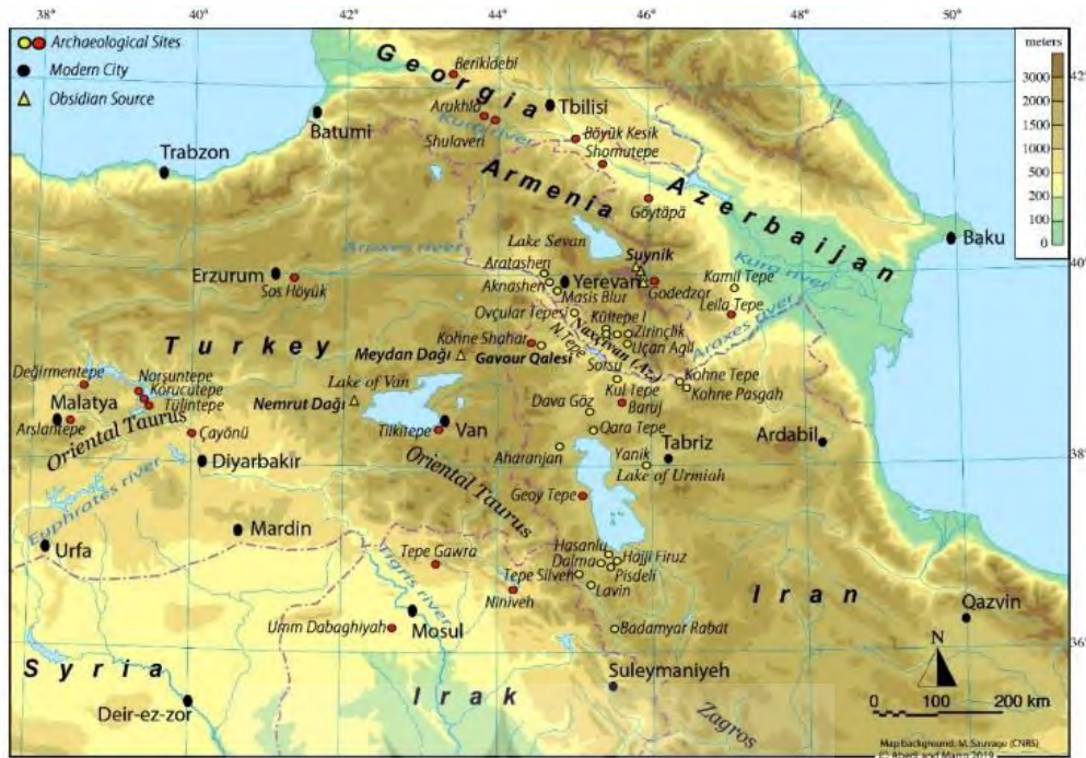
نقشه ۱: موقعیت تپه گاور قلعه سی در شمال غرب ایران و محوطه‌های شاخص عصر مفرغ قدیم قفقاز جنوبی و شرق آناتولی (Abedi and Marro, 2019)