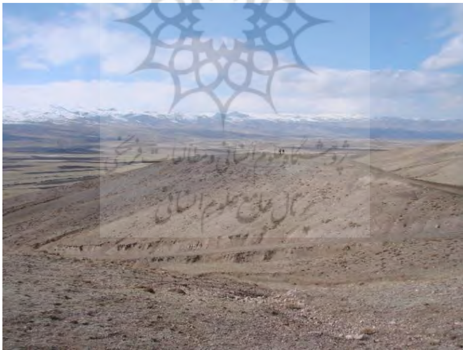
تصویر ۳: دورنمایی از تپه گاور قلعه‌سی، دید از شمال شرق