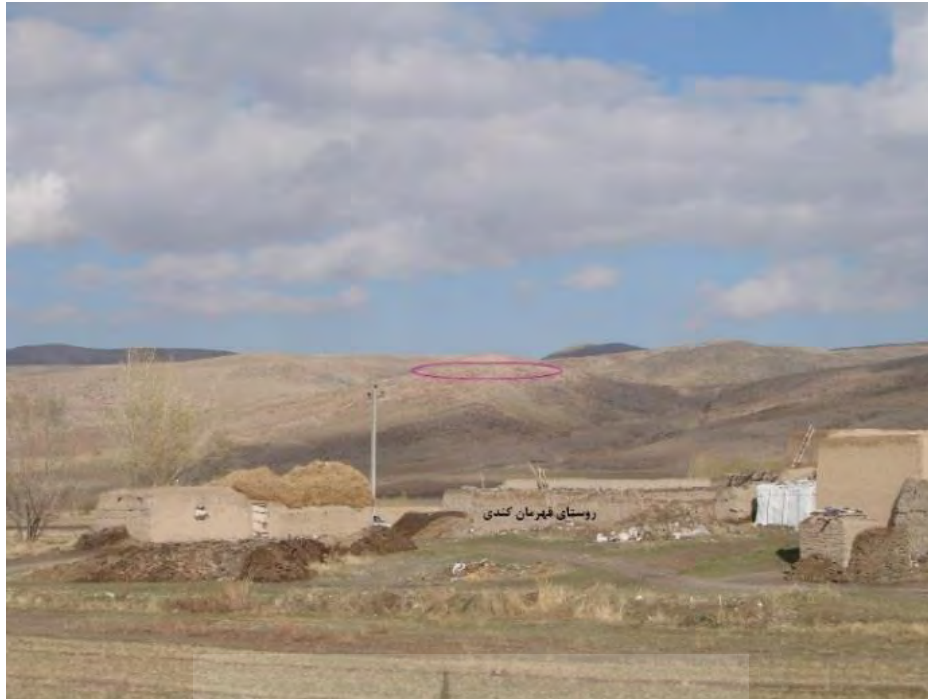
تصویر ۲: دورنمایی از تپه گاور قلعه‌سی، دید از جنوب