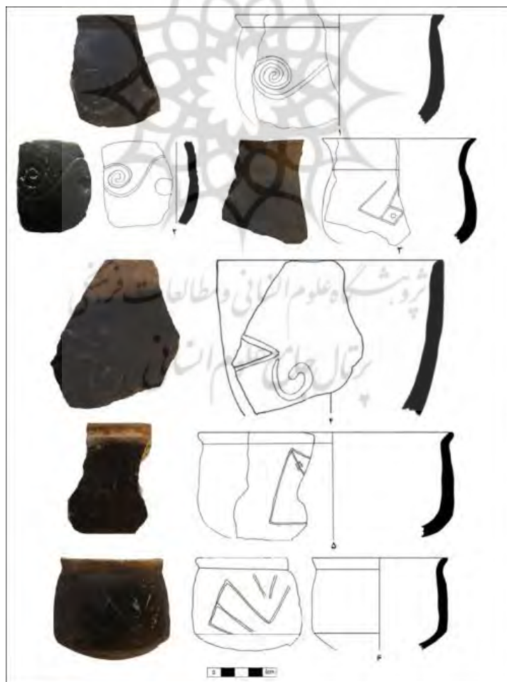
شکل ۱: کوزه‌های سیاه و خاکستری رنگ قلعه گااور با نقوش کنده هندسی و پیچک‌های شاخص فرهنگ سفالی کورا-ارس