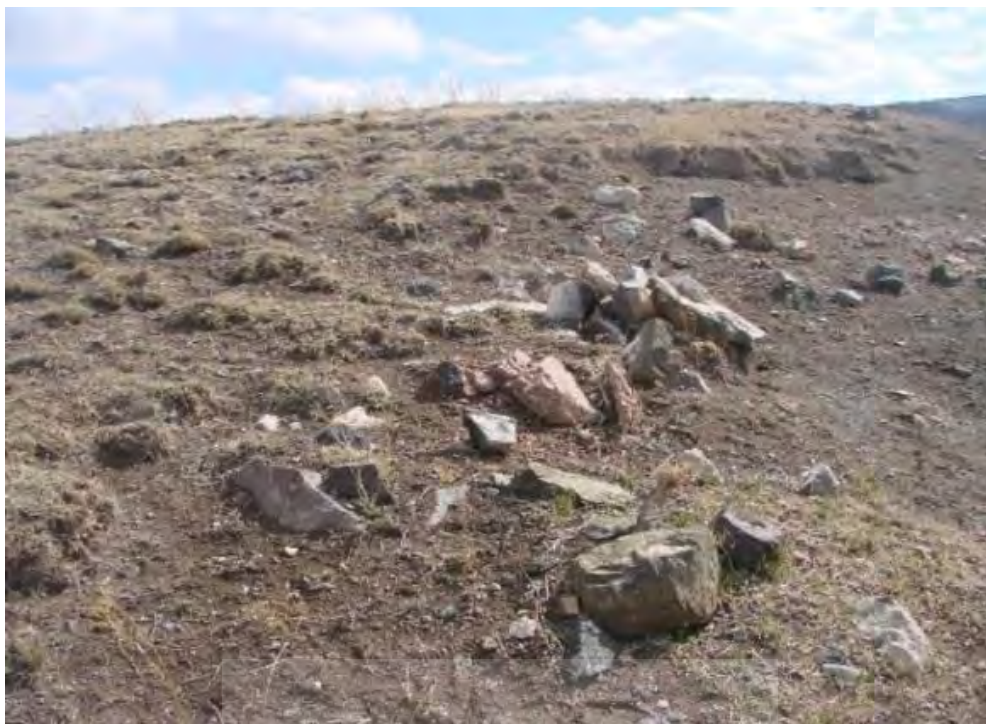
تصویر ۴: بقایای دیوار در بخش جنوبی تپه گاور قلعه سی