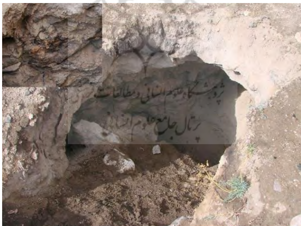
تصویر ۵: چاله حفاری غیر مجاز و نمایان شدن لایه‌ها و نهشته‌های باستان‌شناختی