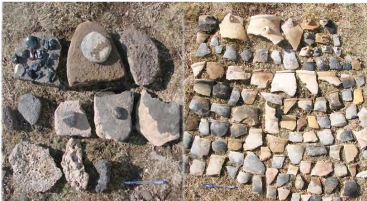
تصویر ۶: مواد فرهنگی سطح تپه گااور قلعه سی