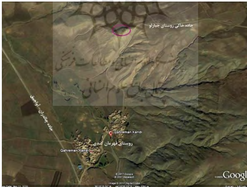
تصویر ۱: موقعیت تپه گاور قلعه سی بر روی عکس هوایی