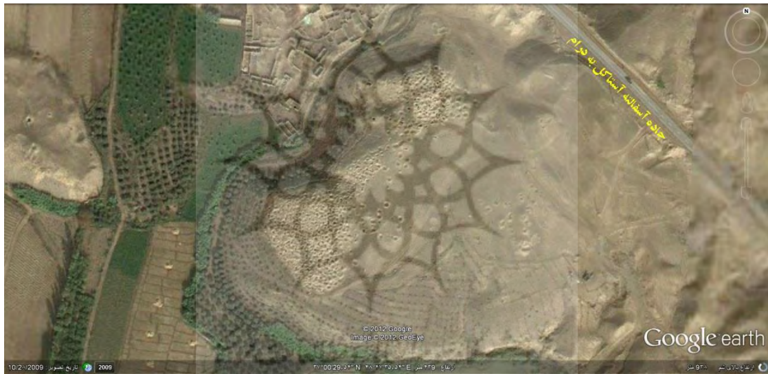
تصویر ۱: گورستان جیران تپه جزلان دشت و فراوانی چاله‌های حفاری غیر مجاز