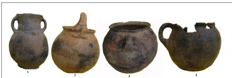
تصویر ۶: نقوش کنده و برجسته به کار رفته روی ظروف سفالی