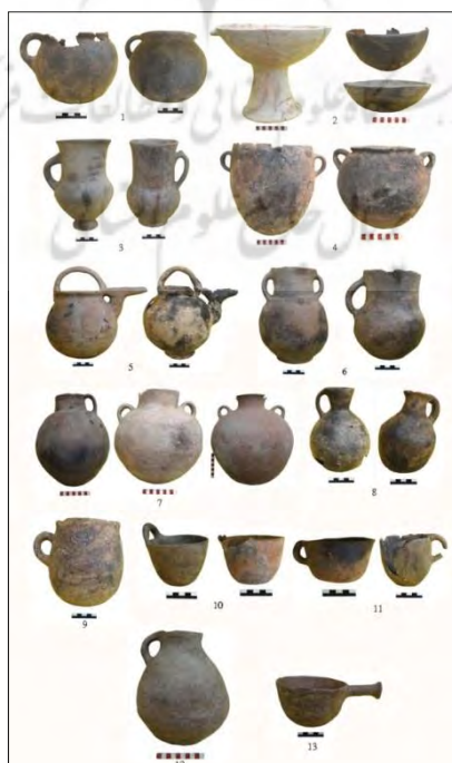
تصویر ۸: عکس گونه‌های مختلف ظروف سفالی