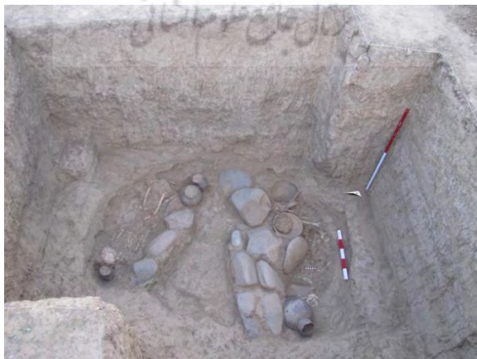
تصویر ۵: تدفین‌های درون گور شماره ۵، ترانشه IV