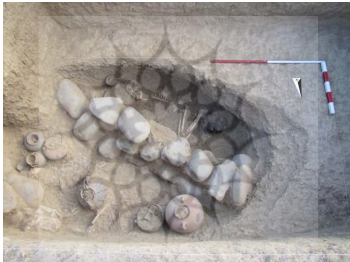
تصویر ۴: تدفین‌های درون گور شماره ۴، ترانشه III