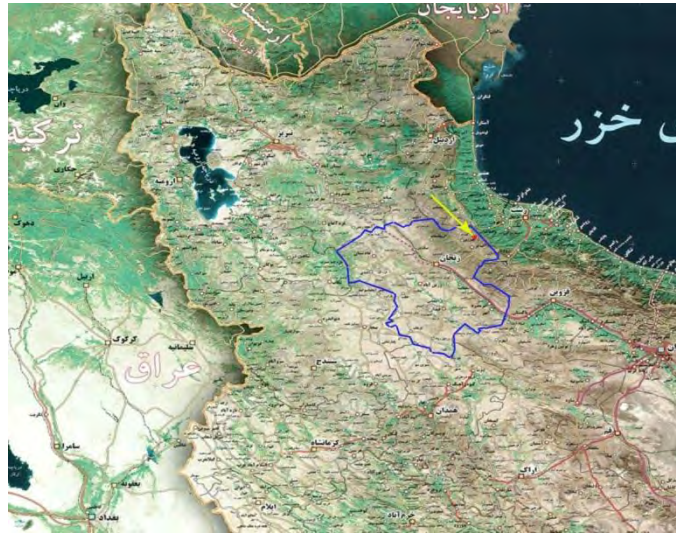
نقشه ۱: موقعیت گورستان جزلان دشت در استان زنجان