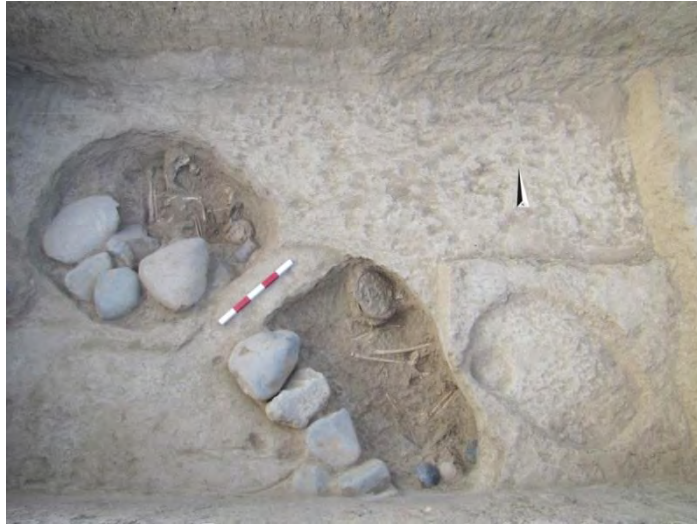
تصویر ۳: گورهای شماره ۲ و ۳ در ترانشه I