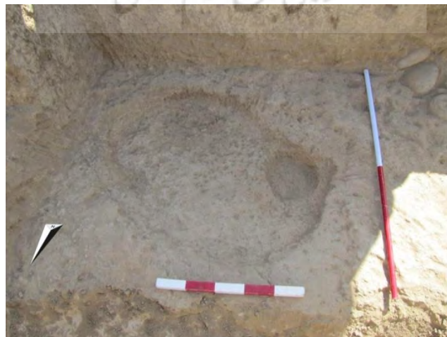
تصویر ۲: گور شماره ۱ در ترانشه I