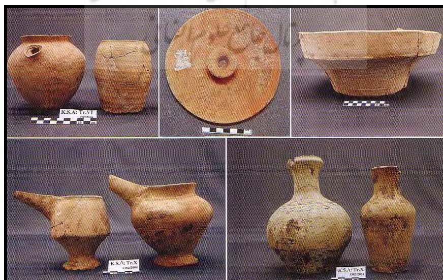
تصویر ۶: سفال‌های شاخص تپه کنارصندل شمالی (برگرفته از Madjidzade, 2008).