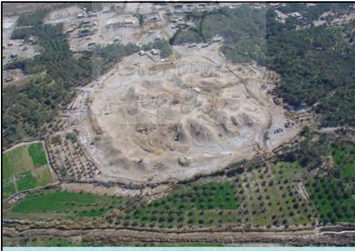
تصویر ۳: عکس هوایی تپه کنار صندل شمالی.