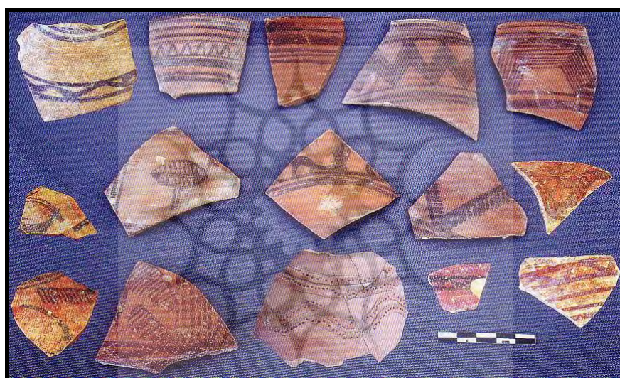
تصویر ۵: سفال‌های شاخص تپه کنارصندل جنوبی (برگرفته از Madjidzade, 2008).