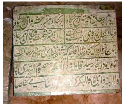
تصویر شماره ۱: کتیبه سنگی میر معصوم بگری.