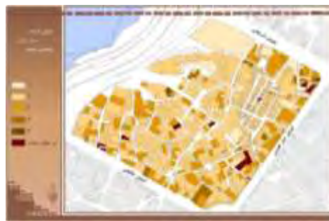
شکل ۱۱. پراکنش جمعیتی محله در شب

تعداد طبقات: اولین فضای امن برای ساکنین پس از فضای خصوصی است و لحظه‌ای خواهد بود که افراد وارد فضای عمومی و نیمه عمومی کوچه‌ها می‌شوند. شکل (۱۳) تعداد طبقات محله و شکل (۱۴) متوسط زمان رسیدن به فضای باز از قطعات را نمایش می‌دهد.