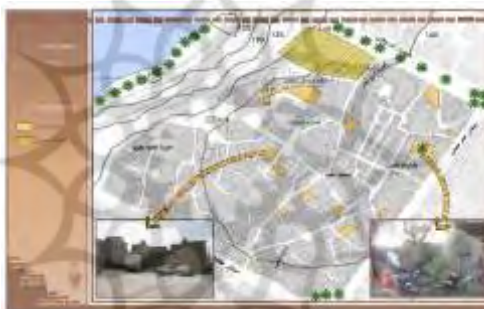
شکل ۴. تنوع فضای سبز و باز در محله قلعه

تنوع فضاهای سبز و باز: وجود بافتی ارگانیک و تو در تو با دانه‌بندی ریز و قطعات کوچک موجب شده است تا در درون محله، فضاهای باز به ندرت دیده شود. تنها فضای باز بدون بنا در درون محله، پارکینگ عمومی شهرداری است که در حاشیه شرقی محله واقع شده است. به جز فضای سبز حاشیه رودخانه که با اختلاف ارتفاع نسبت به سطح محله دیده می‌شود و فضای سبز درون میدان‌ها و بلوارهای واقع در حاشیه محله، در سطح محله هیچ گونه فضای سبزی وجود ندارد (شکل ۴).