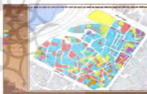
شکل ۱۳. تعداد طبقات محله

تراکم ساختمانی: توجه به تراکم ساختمانی با توجه به نقش و عملکرد بافت، در تاب‌آوری شهری در برابر زلزله امری مهم و ضروری است و می‌باید متناسب با نقش و عملکرد بنا در بافت و فضای شهری باشد (شکل ۱۵). کیفیت بنا: کیفیت ابنیه تاثیر بسیار مهمی بر میزان تاب‌آوری ساختمان‌ها و در نتیجه محله دارد. احتمال مقاومت ساختمان‌ها با کیفیت بالا در مقابل زلزله نسبت به ساختمان‌های مخروبه و مرمتی بیشتر است. شکل (۱۶) کیفیت ابنیه محله را نشان می‌دهد.