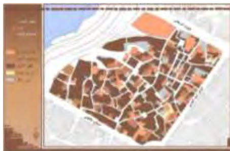
شکل ۱۸. قدمت بناهای محله

قدمت بنا: یکی دیگر از عواملی که در تعیین استحکام ابنیه و تاب‌آوری کالبدی محله در مقابل زلزله نقش مهمی دارد قدمت بنا است. هرچه عمر ساختمان‌ها بیشتر باشد مقاومت ساختمان‌ها در برابر زلزله کاهش می‌یابد. شکل (۱۸) قدمت بنا را نشان می‌دهد.