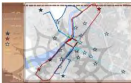
شکل ۶. مراکز درمانی و آتش نشانی شهر دزفول و مسیرهای دسترسی از محله به آنها

دسترسی به خدمات و امکانات شهری: قرار گرفتن این محله در مرکز شهر و در مجاورت جاده ساحلی به عنوان مسیری کم‌برندی که علاوه بر فراهم نمودن دسترسی آسان و سریع به مراکز درمانی اصلی شهر و مراکز آتش نشانی، امکان برقراری ارتباط با نواحی حاشیه و خارج از شهر را نیز میسر نموده است (شکل ۶).