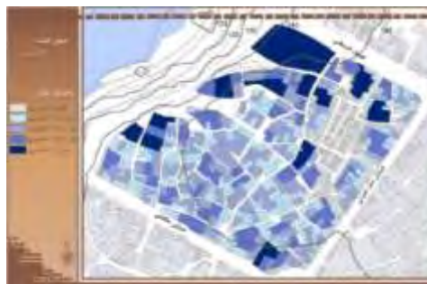
شکل ۷. دانه‌بندی قطعات در محله قلعه