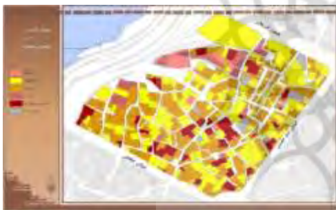
۱۴. متوسط زمان خروج از ساختمان و رسیدن به فضای کوچه

تعداد طبقات: اولین فضای امن برای ساکنین پس از فضای خصوصی است و لحظه‌ای خواهد بود که افراد وارد فضای عمومی و نیمه عمومی کوچه‌ها می‌شوند. شکل (۱۳) تعداد طبقات محله و شکل (۱۴) متوسط زمان رسیدن به فضای باز از قطعات را نمایش می‌دهد.