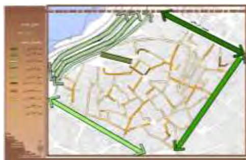
شکل ۸. عرض معابر محله قلعه

نفوذپذیری در بافت‌های فرسوده: قطعات تشکیل دهنده بافت مسکونی سنتی دزفول و محله قلعه ریزدانه بوده (میانگین قطعات حدود ۱۴۸ مترمربع) و بواسطه شکل اندام‌واره بافت، شکل هندسی منظمی ندارند (نقشه ۷). بلوک‌های شهری نیز که از تجمع قطعات به وجود آمده‌اند، نامنظم و کوچک بوده، همراه با کوچه‌های تنگ و تو در تو، موجب بوجود آمدن کوچه‌های بن‌بست و بن‌باز بسیاری در بافت گردیده و در کل نفوذپذیری و دسترسی به بافت را با مشکل مواجه نموده است. ریزدانه‌گی بلوک‌های موجود در سطح محله، ارتباطات را برای عابرین پیاده و موتورسواران میسر می‌نماید؛ با این وجود به دلیل عرض کم معابر دسترسی سواره به درون بافت با مشکلاتی همراه است. همچنین همانطور که در شکل (۸) مشخص است اکثر معابر ۴ تا ۶ متری هستند که با توجه به کم عرض بودن معابر محله، تغییر ناگهانی عرض معابر، تو در تو بودن آن‌ها، دسترسی به فضاها و خدمات شهری در زمان بحران دشوار خواهد بود.