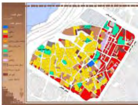
شکل ۳. تنوع عملکردی کاربری های شهری محله قلعه

تنوع فضاهای سبز و باز: وجود بافتی ارگانیک و تو در تو با دانه‌بندی ریز و قطعات کوچک موجب شده است تا در درون محله، فضاهای باز به ندرت دیده شود. تنها فضای باز بدون بنا در درون محله، پارکینگ عمومی شهرداری است که در حاشیه شرقی محله واقع شده است. به جز فضای سبز حاشیه رودخانه که با اختلاف ارتفاع نسبت به سطح محله دیده می‌شود و فضای سبز درون میدان‌ها و بلوارهای واقع در حاشیه محله، در سطح محله هیچ گونه فضای سبزی وجود ندارد (شکل ۴).