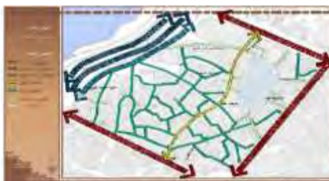
شکل ۵. سلسله مراتب شبکه دسترسی محله قلعه