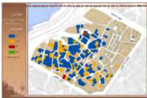
۱۲. تراکم جمعیتی محله در شب

۴. استحکام: با توجه به مرور ادبیات تحقیق و مصاحبه با خبرگان، این مؤلفه از شاخص‌های پراکنش و تراکم جمعیتی، تعداد طبقات، تراکم ساختمانی، کیفیت بنا، مصالح بنا، قدمت بنا مورد بررسی قرار می‌گیرد. پراکنش و تراکم جمعیتی: شاخصی است که مشخص کننده بار جمعیتی بر معابر در مواقع زلزله می باشد. با بیشتر شدن تراکم جمعیتی، سرعت پناه گیری و خدمات رسانی و امداد پایین می آید و بالطبع باعث کاهش تاب‌آوری می‌گردد. شکل (۱۱) پراکنش جمعیتی محله در شب و شکل (۱۲) تراکم جمعیتی محله در شب را نشان می‌دهد که تراکم جمعیتی محله در شب قسمت شمالی و بویژه شرقی محله بسیار پایین و در قسمت غربی و جنوب غربی بیشتر است.