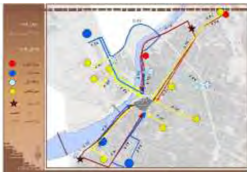
شکل ۱۰. خدمات شهری پشتیبان محله

تعدد فضاهای سبز و اراضی باز عمومی: فضاهای سبز و فضاهای باز عمومی در درون محله تنها شامل فضای پارکینگ شهرداری و محوطه‌های باز بناهای عمومی از قبیل مساجد، حوزه علمیه و مدرسه می‌باشد که می‌توانند به عنوان مکان‌های تخلیه در مرحله امداد و نجات و اسکان اضطراری و اسکان موقت مورد بهره برداری قرار گیرند. نزدیک‌ترین فضاهای سبز و اراضی باز عمومی در بیرون محله، که شامل زمین‌های خالی، اراضی بایر و پارک‌ها می‌باشند، در قسمت شرق و غرب محله واقع شده‌اند. شکل (۴) مکان تعدد فضاهای سبز را نمایش می‌دهد.