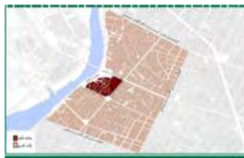
شکل ۱. محله قلعه در بافت قدیم دزفول (نگارندگان، ۱۴۰۰) شکل ۲. پهنه‌بندی خطر زلزله در استان خوزستان (اسکندری و همکاران، ۱۳۸۷)