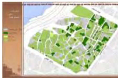
شکل ۱۷. مصالح بنا