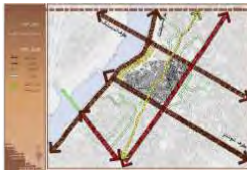
شکل ۹. راه‌های ارتباطی جایگزین پیرامون محله