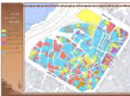
شکل ۱۵. تراکم ساختمانی محله