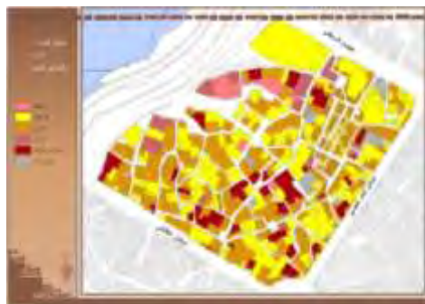
شکل ۱۶. کیفیت ابنیه محله

تراکم ساختمانی: توجه به تراکم ساختمانی با توجه به نقش و عملکرد بافت، در تاب‌آوری شهری در برابر زلزله امری مهم و ضروری است و می‌باید متناسب با نقش و عملکرد بنا در بافت و فضای شهری باشد (شکل ۱۵). کیفیت بنا: کیفیت ابنیه تاثیر بسیار مهمی بر میزان تاب‌آوری ساختمان‌ها و در نتیجه محله دارد. احتمال مقاومت ساختمان‌ها با کیفیت بالا در مقابل زلزله نسبت به ساختمان‌های مخروبه و مرمتی بیشتر است. شکل (۱۶) کیفیت ابنیه محله را نشان می‌دهد.