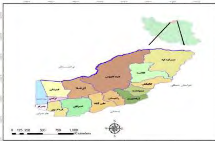
شکل ۱. قلمرو جغرافیایی پژوهش