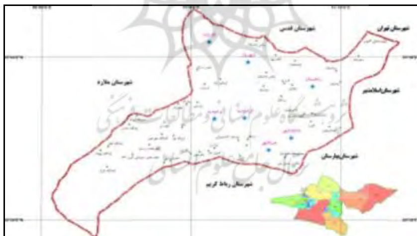
شکل ۲. پراکندگی شهرها و روستاهای شهرستان شهریار