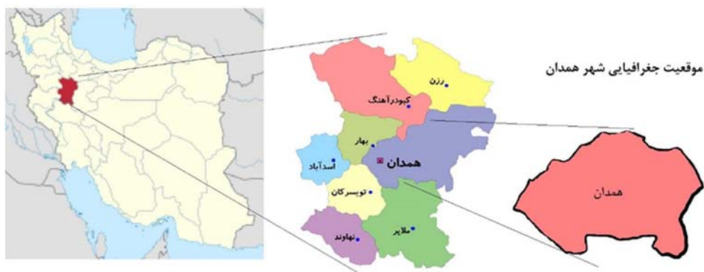
شکل ۱، موقعیت جغرافیایی شهرستان همدان