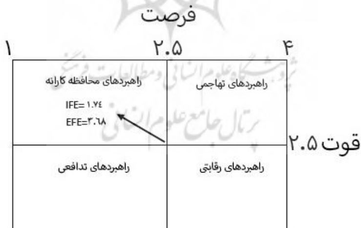
شکل ۲. ماتریس ارزیابی عوامل داخلی و خارجی

بعد از سنجش وضعیت جداول سوات و مشخص شدن جایگاه محدوده، راهبرد متناسب با آن تدوین می‌گردد. همان طور که در نمودار یک دیده می‌شود راهبرد اصلاحی برای بازآفرینی پایدار در سکونتگاه‌های غیررسمی شهر رشت در محدوده WO (راهبرد محافظه کارانه یا حداقل - حداکثر) قرار می‌گیرد. این راهبرد به منظور بهره‌گیری از فرصت‌ها جهت به حداقل رساندن ضعف‌ها انتخاب شده است (کلکار، ۱۳۸۴).