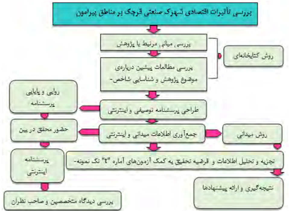
شکل ۱. فرآیند کلی پژوهش

با توجه به اهمیت موضوع شهرک‌های صنعتی در مناطق مختلف جهان اندیشمندان پژوهش‌هایی را انجام داده‌اند بنابراین، از آنجا که جان دیوئی، اعتقاد دارد که پیشینه تحقیق به محقق کمک می‌کند تا بینش عمیقی نسبت به جنبه‌های مختلف موضوع تحقیق پیدا کند و مطالعه منابع باید از منابعی باشد که به‌طور مستقیم در رابطه با موضوع تحقیق باشند و نیز از منابعی باشد که به‌صورت غیرمستقیم با آن موضوع ارتباط داشته باشند (پوراحمد و همکاران، ۱۳۹۳: ۶۵)، لذا به معرفی برخی از این پژوهش‌ها در قالب جدول زیر پرداخته شده است: