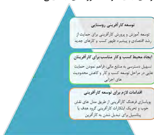
شکل ۱. هرم توسعه کارآفرینی روستایی مأخذ: فلاح حقیقی، ۱۳۹۶: ۱۲۵

کارآفرینی روستایی با چالش‌های متعددی همچون منابع انسانی، کاهش جمعیت و بازار محلی کوچک، دور بودن نواحی روستایی، منابع مالی، رقابت‌پذیری، زیرساخت ارتباطات و حمل و نقل، قوانین و مقررات و موانع اجتماعی-فرهنگی رو به رو می‌باشند.