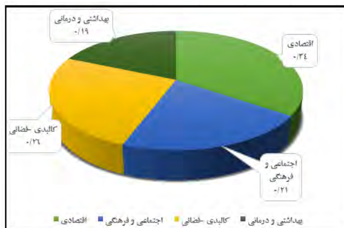
شکل ۲. رتبه‌بندی ابعاد توسعه پایدار در شهر با تاکید بر جایگاه اقتصادی چابهار

مطابق جدول (۸)، و شکل (۲)، در بین معیارهای مطرح شده، به ترتیب معیار X1 (اقتصادی) با وزن نرمال نشده ۰/۰۵۶ ، و وزن نرمال شده ۰/۳۴۵ ، معیار X3 (کالبدی - فضائی) با وزن نرمال نشده ۰/۰۶۱ ، و وزن نرمال شده ۰/۲۵۶ ، معیار X2 (اجتماعی و فرهنگی) با وزن نرمال نشده ۰/۰۶۷ ، و وزن نرمال شده ۰/۲۱۳ ، معیار X3 (بهداشتی و درمانی) با وزن نرمال نشده ۰/۰۷۸ و وزن نرمال شده ۰/۱۸۶ ، بالاترین و پایین‌ترین رتبه را به خود اختصاص داده‌اند. در ادامه نیز به منظور بررسی تاثیر برند اقتصادی چابهار در توسعه پایدار، ابعاد (اقتصادی، اجتماعی، کالبدی، بهداشتی و درمانی) با بهره‌گیری از پرسشنامه‌های توزیع شده بین جامعه نمونه ساکنین شهر چابهار از آزمون رگرسیون چندگانه استفاده شد. نتایج به شرح جدول (۹) است.