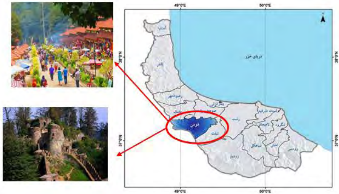
شکل ۲. نقشه شهرستان فومن در استان گیلان و جاذبه‌های گردشگری آن (قلعه رودخان و بازارچه قلعه رودخان)