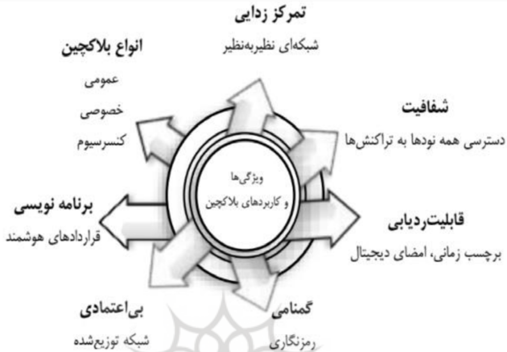
شکل ۱: مهم‌ترین ویژگی‌ها و کاربردهای بلاکچین برگرفته از (Gudkov, 2017; Bashir, 2020: 352)

گه و کواک ۱ (2019) به شناسایی میزان پذیرش فناوری بلاکچین در کشورهای کوچک جزیره‌ای ۲ پرداختند و فرصت‌ها، چالش‌های بالقوه و راهکارهای عملی برای ذی‌نفعان حوزه گردشگری ارائه دادند. نتایج نشان داد فناوری بلاکچین، علاوه بر این‌که به ارتقای گردشگری در کشورهای جزیره‌ای کوچک فاقد منابع منجر می‌شود، سیستم مالی آن را نیز از خطر مصون می‌دارد. بلاکچین فناوری نوپا است و برای پذیرش منسجم آن در جامعه و استقرار موفقیت‌آمیز آن در میان صنایع به همکاری دولت، گردشگران، مشاغل و سازمان‌های بازاریابی مقاصد نیاز دارد. به‌منظور توسعه گردشگری از طریق فناوری بلاکچین باید دسترسی و فراگیر شدن آن را در میان ذی‌نفعان تشویق کرد. همچنین، وجود فناوری‌ها در مناطق کوچک با منابع اندک می‌تواند سبب تنوع در اقتصاد این کشورها شود و مانند جزیره‌ی مالت در اروپا و موریس در آفریقا به تقویت و جهش اقتصادهای توسعه‌یافته با ارائه محصولات کارآمد بینجامد. رجب و همکاران (۲۰۱۹) مزایای بالقوه زنجیره بلوکی را بررسی کردند و به این نتیجه رسیدند که فناوری بلاکچین در گردشگری پزشکی با هدف اعتماد و اعتبار بین پزشک و بیمار و انسجام