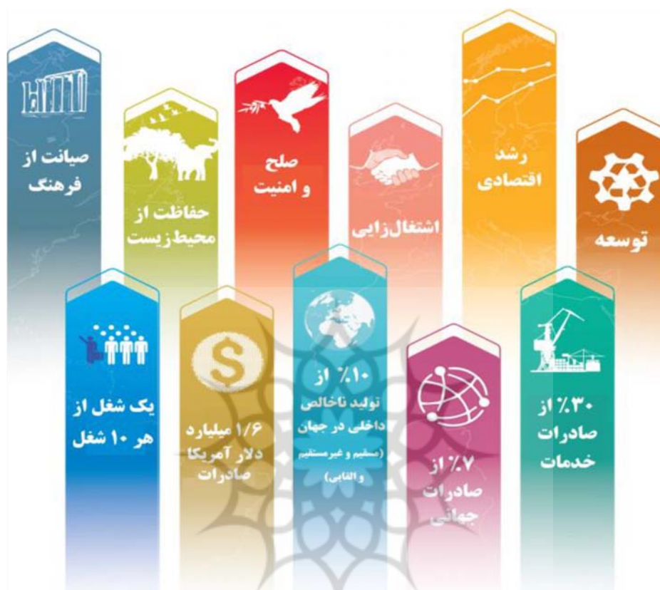
شکل ۱: نتایج توسعه گردشگری در جهان

سهمی بیش از ۶ درصد از کل اشتغال کشور را تشکیل می‌داد. پیش‌بینی می‌شد که، در سال ۲۰۱۸، میزان اشتغال سفر و گردشگری، در مقایسه با سال ۲۰۱۷، رشد ۴/۹ درصدی داشته باشد و، طی ۱۰ سال آینده، متوسط رشد سالانه‌ای معادل ۱/۵ درصد رقم بخورد (Karimi Amirkiasar, 2018: 3-7).