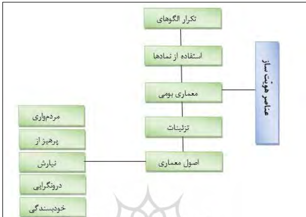
شکل ۱: عناصر هویت‌ساز معماری ایرانی