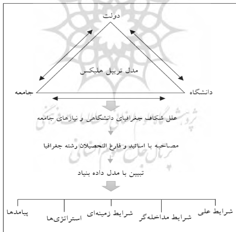
شکل ۱. مدل تحلیلی پژوهش

رویکرد این پژوهش از نوع کیفی استقرایی، مبتنی بر نظریه داده بنیاد یا زمینه‌ای است. نظریه زمینه‌ای، نظریه‌ای است که مستقیماً از داده‌هایی استخراج شده است که در جریان پژوهش به صورت منظم گردآمده و تحلیل شده‌اند. در این روش، پژوهشگر، کار را در عرصه واقعیت آغاز می‌کند و می‌گذارد تا نظریه از درون داده‌هایی که گرد می‌آورد، پدیدار شود. از آنجاکه نظریه‌های زمینه‌ای به سبب آنکه از داده‌ها بیرون کشیده می‌شوند، بیشتر می‌توانند بصیرت افزا باشند و فهم را تقویت کنند و راهنمای عمل باشند (Strauss & Carbine, 2007). جامعه آماری شامل اساتید، دانشجویان، فارغ‌التحصیلان رشته جغرافیا بوده‌اند. روش جمع‌آوری داده‌ها به صورت مصاحبه و شامل ۳۰ مصاحبه با استادان و فارغ‌التحصیلان جغرافیا در شهر مشهد می‌باشد. ملاک نمونه‌گیری، اشباع نظری و انتخاب نمونه‌ها تا آنجایی ادامه یافته است که مطالب مصاحبه‌شوندگان تکراری بوده و داده‌های اضافی به تکمیل و مشخص کردن یک مقوله نظری کمکی نکرده و مصاحبه‌ها مشابه به نظر رسیدند، لذا مصاحبه‌ها تا مصاحبه ۳۰ ادامه یافت. شکل ۱ مدل تحلیلی و جدول ۲ مشخصات کلی نمونه آماری را نشان می‌دهد.