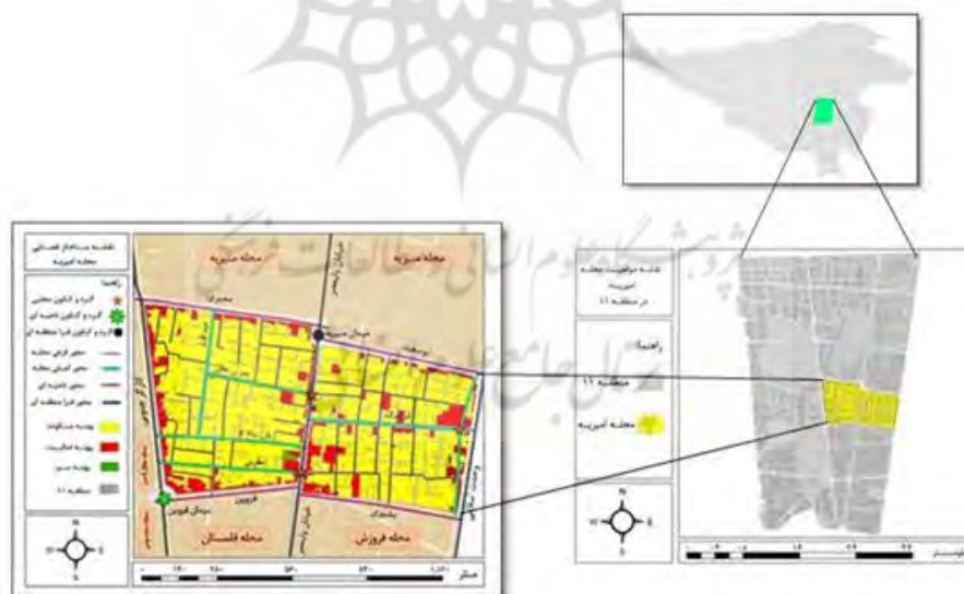
شکل ۱. نقشه موقعیت محله امیریه در منطقه ۱۱ شهرداری تهران به همراه ساختار فضایی محله

محله امیریه در منطقه ۱۱ شهرداری تهران قرار دارد که با این محله با وسعتی در حدود ۸۴۵،۱۸۹ مترمربع از شمال به محله منیریه، از جنوب به محله فروزش و قلمستان، از غرب به محله مخصوص واقع در ناحیه سه منطقه ۱۱ و از شرق به منطقه ۱۲ شهرداری تهران محدود می‌شود. جمعیت این محله طبق سرشماری سال ۹۵ برابر با ۲۴۸۱۱ نفر بوده است. محله امیریه هسته اولیه شهر و محله امیرنشین، جز املاک شاهزادگان قاچار بوده و نام آن برگرفته از باغ امیریه است که کامران میرزا و مادر او منیرالسلطنه در این محل احداث نموده و محله را پایه‌گذاری کرده‌اند. در محله امیریه هنوز هم‌خانه‌هایی با قدمت ۶۰ تا ۱۰۰ سال وجود دارد. این خانه‌ها هم چنان نمای آجری و کاشی‌های رنگی و حتی آجرهای لعاب‌دار آبی‌رنگ خود را حفظ کرده‌اند و اغلب دارای حیاط مرکزی هستند که بعدها به‌صورت ساختمان مرکزی درآمده‌اند.