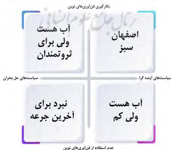
شکل ۱. سناریوهای آینده آب شهر اصفهان

بر اساس نتایج حاصل دو پیشران سیاست‌های آب و سرمایه‌گذاری در فناوری‌های نوین به‌عنوان دو عدم قطعیت اصلی تحقیق حاضر انتخاب و سناریوها بر اساس این دو عدم قطعیت تدوین شدند (شکل شماره ۱). در مورد اسامی چهار سناریو در پانل خبرگان بحث و تبادل نظر شد و در انتها روایتی از هر یک از سناریوها تدوین شد. در تدوین روایت هر سناریو سعی شد همگی عوامل کلیدی و پیشران‌ها به‌نوعی منعکس شده باشند.