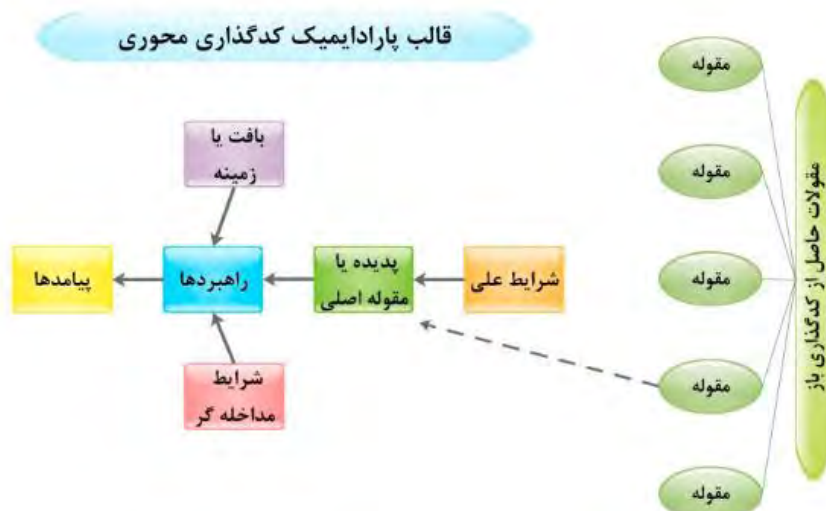
شکل ۱. مدل مفهومی تحقیق