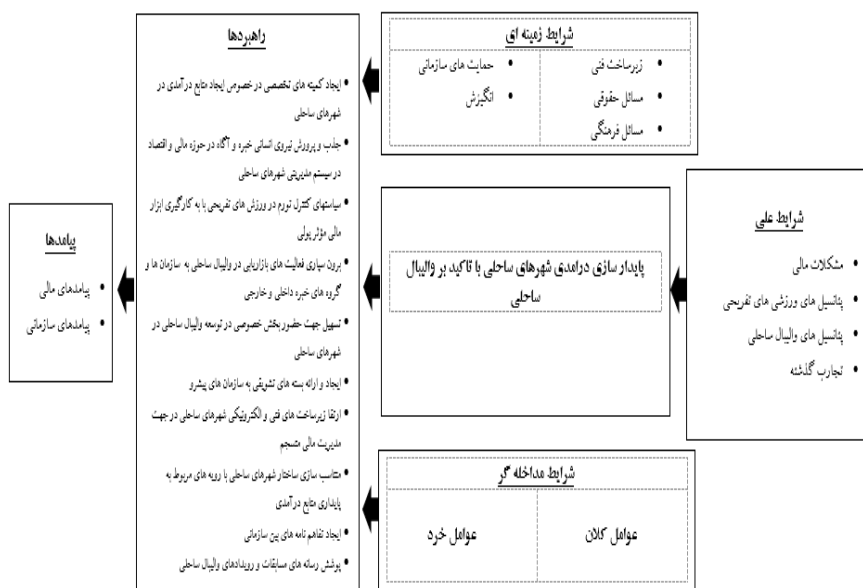
شکل ۲. مدل پاداریمی تحقیق