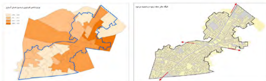
شکل ۴. توزیع فقر شهری و شبکه معابر در محدوده مورد مطالعه، منبع: (مشاور طرح و معماری و مطالعات پژوهشگران)