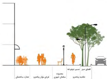
تصویر ۱. عناصر تشکیل‌دهنده پیاده‌رو (آیین‌نامه طراحی معابر شهری، ۱۳۹۹، ۱۴)

ارتباط مؤلفه‌های آسایش با کیفیت فضا و عناصر تشکیل‌دهنده پیاده‌روهای خیابان‌های تجاری است.