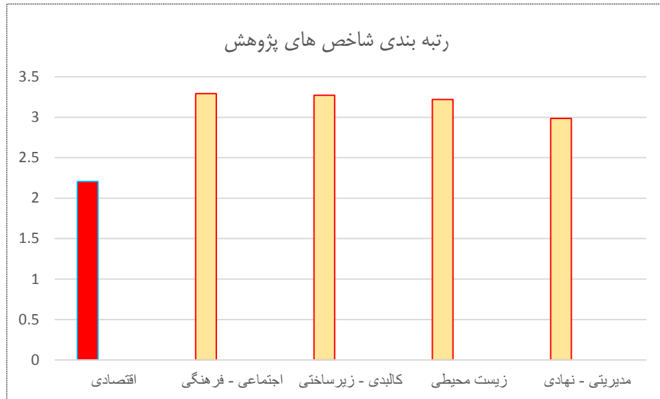
شکل ۳. نمودار رتبه بندی شاخص های تحقیق

(جدول شماره ۶) مقدار آماره کی دو ( \chi^2 )، درجه آزادی (df) و معنی داری آماری (sig) را نشان می دهد.