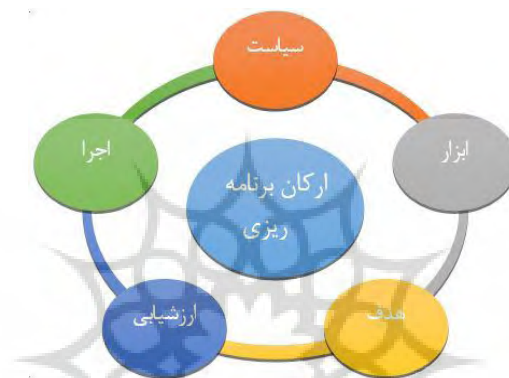
شکل ۱. ارکان برنامه‌ریزی (مأخذ: خلیلی آبادی، ۱۳۹۰: ۴)

کوتاه مدت به منظور بهره‌برداری منطقی و هماهنگ از امکانات و منابع برای تأمین نیازمندی‌های عمومی و اساسی جامعه است (معصومی اشکوری، ۱۳۹۰: ۳۲-۳۳). با وجودی که ساز و کار برنامه‌ریزی در جوامع گوناگون دارای نقش، مقصود، جایگاه، انگیزه و پیامدهای ویژه خود است؛ پویایی و رشد آن را می‌توان همچون یک فرایند افزوده شده به فرایندهای از پیش موجود در جامعه نیز مشاهده نمود. به هر روی اصلی‌ترین و متداول‌ترین زمینه بروز برنامه‌ریزی جوامع صنعتی پیشرفته بوده است که سیستم برنامه‌ریزی را همچون بخشی از نقش در حال رشد حکومت‌های خود به کار گرفته‌اند (عبدی دانشپور، ۱۳۹۰: ۱۳). برنامه‌ریزی فرایندی است منظم، مداوم، حساب شده، منطقی، جهت‌دار و دورنگر که به منظور هدایت و ارشاد فعالیت‌های جمعی برای رسیدن به هدف مطلوب (فنی و کاظمی، ۱۳۹۵: ۲). که در جست‌وجوی کنترل آینده نزدیک است (عنایت‌اله ۱ ، ۲۰۱۱).