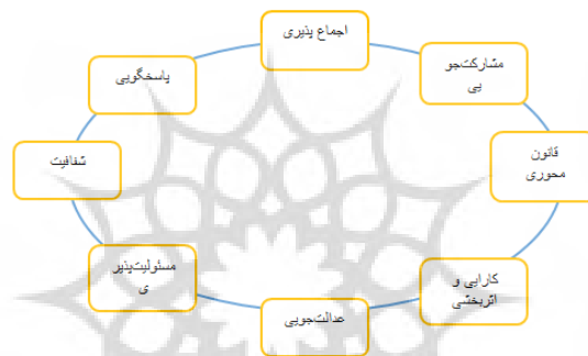
شکل ۱: ویژگی های حکمرانی خوب

پاسخگویی یک امر حیاتی برای مساله حکمرانی خوب است. نه تنها نهادهای دولتی بلکه بخش خصوصی و سازمان های جامعه مدنی باید نسبت به عموم مردم و همه افراد ذی نفع پاسخگو باشند. به طور کلی یک نهاد یا سازمان نسبت به کسانی که در ارتباط مستقیم با تصمیمات آنها قرار دارند، پاسخگو خواهند بود. لازم به ذکر است پاسخگویی بدون وجود شفافیت و حاکمیت قانون قابل اجرا نیست. مجموعه این شاخص ها را می توان به عنوان دستورالعملی برای تعامل هرچه بهتر سه بخش دولت، بخش خصوصی (بازار) و جامعه به معنای نوین آن تلقی کرد.