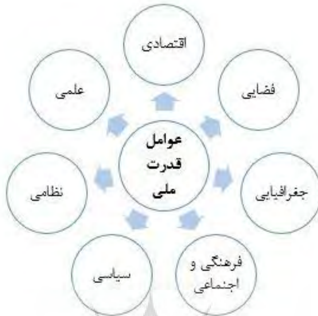
شکل شماره (۴) عوامل قدرت ملی