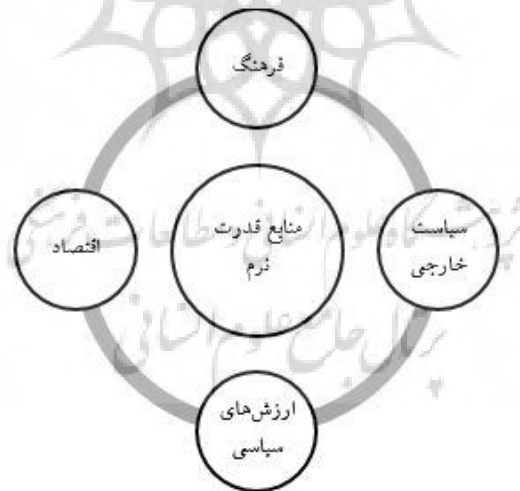
شکل شماره (۲) منابع قدرت نرم

سیاست خارجی: به نظر نای سیاست خارجی و داخلی می‌تواند قدرت نرم را تضعیف یا تقویت کند. اگر سیاست‌های داخلی یا خارجی متکبرانه و بی توجه به آرای دیگران و یا بر اساس روش تنگ نظرانه ای تدوین شوند می‌توانند در کاهش قدرت نرم مؤثر باشند اگر یک کشور سیاست خارجی خود را به گونه‌ای تنظیم نماید که بتواند دیگران بدون استفاده از تهدید یا تطمیع بسیج نماید پس سیاست خارجی آن کشور منبع مهمی برای قدرت نرم است. همچنین اگر سیاست خارجی در برگیرنده اهداف مشترک بیشتری با سایر کشورها باشد جذابیت بیشتری دارد از سوی دیگر اگر سیاست خارجی بر پایه تعاریف گسترده و دوراندیشانه از منافع ملی باشد دیگران را بیشتر جذب خواهد کرد (عسگری ۱۳۸۹: ۷۰).