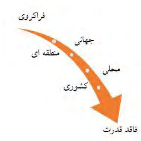
شکل (۳) سطوح قدرت