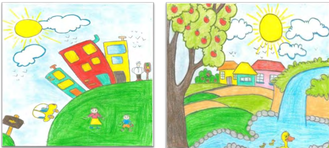
شکل ۵ و ۶. طراحی شهر مورد علاقه

در تصویر ۵ کودک شهری را طراحی کرده است که در نزدیکی مجتمع‌های مسکونی فضای سبز و زمین چمن برای بازی بچه‌ها باشد. هم چنین در این نقاشی کودک با ترسیم چراغ راهنمایی به نظم شهر اهمیت داده است و اینکه وجود پلیس در این شهر نشان دهنده توجه کودک به امنیت می‌باشد تا بتواند به تنهایی در بیرون از منزل به بازی و فعالیت پردازند. در تصویر ۶ با طراحی فضای سبز و طبیعت از زندگی یکنواخت و بی روح شهری خسته شده است و محیطی را می‌پسندد که در آن بتواند به درختان مثمر و غیر مثمر دسترسی داشته باشد و اینکه بیشتر در ارتباط با حیوانات و بازی با آن‌ها باشد و فقط با فضای سبز و محیطی بدون آلودگی ارتباط داشته باشد.