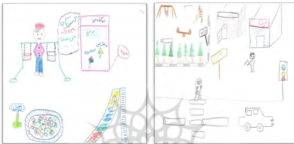
شکل ۳ و ۴. شهر مورد علاقه کودکان

نقاشی کنند، کودکان نقاشی را محل مناسبی برای خواسته‌ها و آرزوهای خود می‌دانند، نقاشی کردن را شاید بتوان یکی از ابتدایی‌ترین روش‌های مشارکت کودکان قلمداد کرد که از بین ۲۰ نقاشی گرفته شده به دلیل مضیفه تعداد صفحات، در اینجا تعداد ۴ نقاشی به عنوان الگوی نقاشی‌ها ارائه گردید. نقاشی کردن از متداول‌ترین روش‌ها برای مشارکت دادن بچه‌ها در فرآیند طراحی مشارکتی شهر دوستدار کودک است.