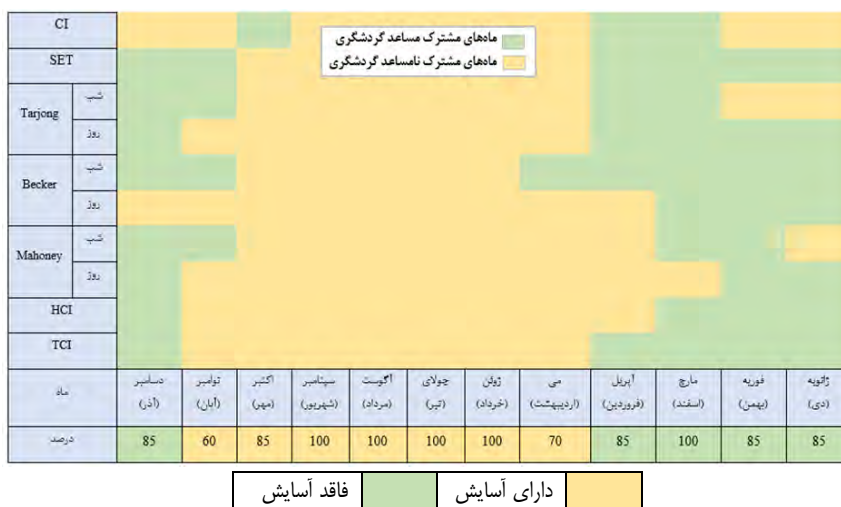
شکل ۳. نتایج مقایسه‌ای شاخص‌های اقلیم آسایش گردشگری

مطابق شکل ۳ و جدول ۱۹، مقایسه نتایج شاخص‌های اقلیم گردشگری حاکی از آن است که بیشترین رتبه مربوط به شاخص TCI (با رتبه ۱۶) می‌باشد. در بین سایر شاخص‌ها همچنین، به ترتیب بیشترین رتبه به شاخص‌های تراجونگ، اقلیم تعطیلات، ماهانی، دمای استاندارد مؤثر، بیکر و فشار عصبی اختصاص یافت.