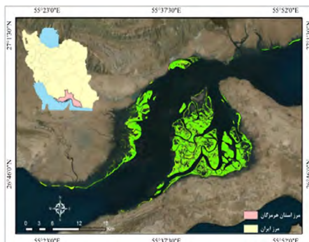
شکل ۱. موقعیت جغرافیایی محدوده مورد مطالعه