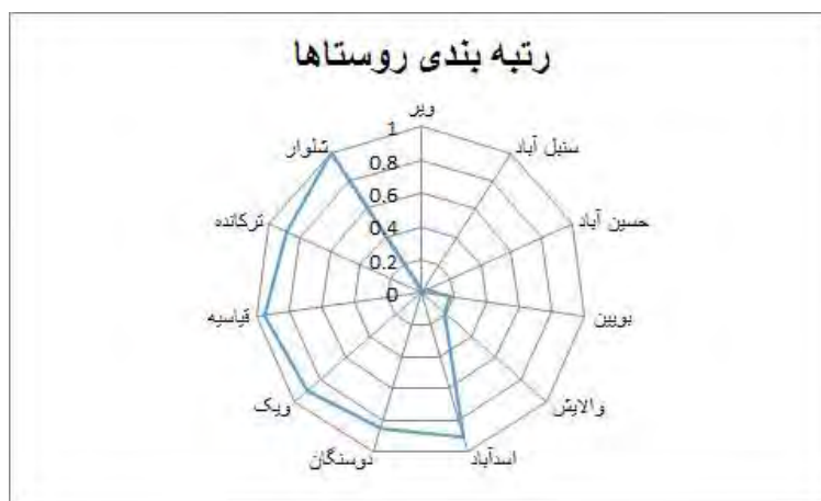
شکل ۳. رتبه بندی نهایی روستاها براساس سرمایه‌های صورت گرفته با مشاء شهری در توسعه روستاها