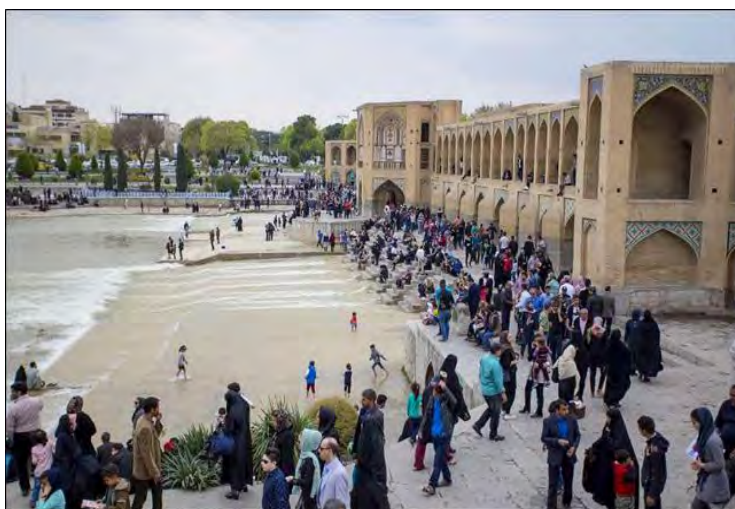
شکل ۲: پل خواجه، علاقه‌مندی مردم به سازه‌های فضایی و گذراندن اوقات خود در کنار آن، تنوعی از موقعیت‌ها و شرایط را برای برقراری تعامل‌های انسانی ارائه می‌دهد. (مأخذ: رامشت و محمدیان، ۱۳۹۹)

می‌داند. وی «قالب‌های معنایی» را نمایانگر بخش‌های یک‌رویداد می‌داند که به مجموعه‌ای از تجربه‌های ذهنی شناسنده معطوف است. این نظریه بیانگر اصل مهمی، در «معناداری زمین» است، اینکه معناداری پدیده‌ها درون نظامی از دانش درک‌شدنی است که در تجربه اجتماعی و فرهنگی انسان شناسنده، ریشه دارد. در شرح «تأویل معنا» می‌توان به مثال ناپایداری کرانه رودخانه‌ای متوسل شد. اگر مسئله ناپایداری کرانه رودخانه‌ای ماندری مدنظر باشد و از سه پژوهشگر ژئومورفولوژیست با تخصص‌های مختلف برای بررسی و حل موضوع ناپایداری مطرح شده، از آن‌ها دعوت به عمل آید تا نسبت به شناخت مسئله و راه‌حلی برای کنترل این پدیده نظر دهند، نتیجه و راه‌حلی که ارائه می‌دهند، تفاوت قابل توجه خواهد داشت. این تفاوت‌ها همگی برگرفته از رابطه بین «پیش‌زمینه ذهنی» و «نتیجه» پژوهشگران و پیش‌فرض‌های تخصصی آن‌ها است.