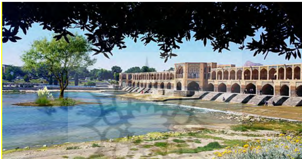
شکل ۱: پل خواجو، هارمونی و نسبت‌ها به شکل کالبدی در ساخت این پل منجر به احساس امنیت برای رهگذران آن شده است

احساس حریم، وی را از خطر دور می‌سازد و نوعی امنیت را به صورت ذهنی برایش فراهم می‌آورد. جالب آن است که این احساس امنیت حتی برای مادران که دارای بچه‌های کوچک هستند نیز به خوبی قابل مشاهده است. مادران به دلیل احساس شدید مادری در مواظبت و نگرانی خاطر از کودکان حساسیت خاصی از