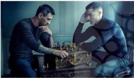
تصویر ۶: نمونه‌ای از عکس‌های لی بویتز

به یک دارایی واقعی و ارزشمند برای صحنه عکاسی معاصر تبدیل شده‌است. از کارهای تجاری گرفته تا صمیمی‌ترین تصاویر او، رشد و توسعه‌ای که او به عکاسی این دوره داده‌است، مثل یک گنج است. مجله رولینگ استون رشد خود را مدیون هنر این عکاس می‌داند. او در سال ۱۹۷۰، در ابتدای فصل شگفت‌انگیز با عنوان معاصر در تاریخ عکاسی، به عنوان یک عکاس معمولی برای مجله شروع کرد. تنها سه سال بعد، به عنوان عکاس ارشد این مجله انتخاب شد. لیبوویتز در حین کار برای رولینگ استون (شغلی که حدود ۱۳ سال به طول انجامید) از مجلات دیگر آگاهی بیشتری پیدا کرد و فهمید که می‌تواند برای مجلات کار کند و هنوز هم کارهای شخصی خلق می‌کند. آنی لیبوویتز از آثار تجاری بالا و بسیار پیچیده‌ای که برای مشتریان بزرگی مانند دیزنی ایجاد شده‌است یا صمیمی‌ترین تصاویر او، یک مرجع با تمام شکوه و عظمت است.