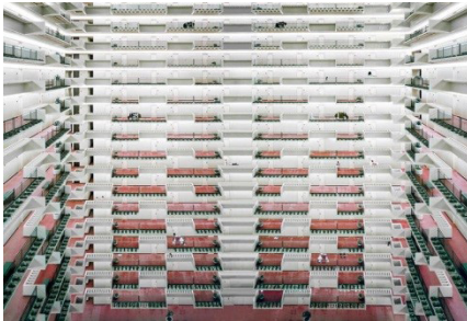
تصویر ۵: نمونه‌ای از عکس‌های گرسکای

۱. آندریاس گرسکای (Andreas Gursky): گرسکای بیشتر از این که به خاطر فروش پرستاب و رکورد زدن در دنیای عکاسی هنرهای زیبا شناخته شود، عکاسی است که دنیای مدرن را به شکلی جذاب به تصویر می‌کشد. تصاویر او مکان‌های رایجی را نشان می‌دهد که واقعا وجود ندارند. او از طریق دست‌کاری دیجیتال، مکان‌های معمولی را تمیز می‌کند تا به زیبایی‌شناسی یا دید شخصی از این مکان‌ها دست یابد. بنا به اظهار خودش این کار را به این دلیل انجام می‌دهد که فکر می‌کند عناصر خاصی در داخل این مکان‌ها او را آزار می‌دهند. همه عکس‌های او نگاه پرابهت و نگاه از بالا ندارند، اما بخشی از سبک نمادین او محسوب می‌شوند.