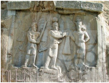
تصویر ۲: حلقه سپاری به اردشیر دوم در طاق بستان

در نقش برجسته موسوم به اردشیر دوم (دهمین پادشاه ساسانی) که در میان سال‌های ۳۷۹ تا ۳۸۳ م در کنار طاق کوچک در طاق بستان اجرا شده‌است، در این نقش، اهورامزدا که در سمت راست اردشیر قرار دارد، حلقه روبان‌دار را به اردشیر اعطا می‌کند. طرف چپ اردشیر دوم، میترا ایستاده‌است که برسم به دست دارد (همان: ۲۰۳) (تصویر ۳).