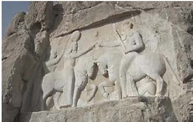
تصویر ۱: صحنه حلقه سپاری اردشیر بابکان در نقش رستم، (موسوی حاجی و سرفراز، ۱۳۹۶: ۲۲۱)

اطلاق می‌شود (تصویر ۱) حلقه سلطنتی تجسم فره ایزدی و نشان الهی بودن مقام پادشاه است. در یک صحنه حلقه سپاری، با این که ایزد بزرگی