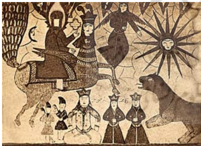
تصویر ۷: نقاشی دیواری معراج در بقعه آقا سید محمد در دهکده پینچا آستانه، (ذبیحی و ستوده، ۱۳۵۴: ۱۴۹)

۶. تصویر به معراج رفتن پیامبر ﷺ در بقعه سید محمد با ویژگی‌های بارز قاجاری است. در کنار عناصر تصویری مشترک در سایر نگاره‌های معراج، این نگاره دارای ویژگی خاص خویش است و آن وجود خورشید و ماه در این نگاره است. جبرئیل در کنار براق در هوا معلق است و در پشت سر او شش فرشته که فقط سر و دست‌هایشان پیداست، قرار دارند. به دلیل آسیب‌های فراوان به این نقاشی دیواری اسامی افراد ایستاده و نشسته در پایین تصویر به درستی مشخص نیستند. شیرگران هم در سمت راست در حالی که زبانش باز دهانش بیرون زده به صحنه اعطای انگشتر نگاه می‌کند (بهارلو و فهیمی فر، ۱۳۹۶: ۹۵) (تصویر ۷).