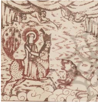
تصویر ۹: چاپ سنگی، انگشترسپاری در معراج، از نسخه حمله حیدر ۱۲۶۹ ق، (بوذری، ۱۳۸۹: ۱۳۵)

از نوعی زیبایی‌شناسی تقریبا همانند (به سبکی قراردادی بهره می‌برند و قابلیت تکثیر در آن‌ها اولویت دارد؛ مختصاتی که وجوه افتراق و آثار این حوزه را با رسانه‌ای همچون نگارگری بیش‌تر مشخص می‌سازد. در فضا‌سازی تصاویر چاپ سنگی معراج از عناصر محدود استفاده شده‌است. چند تکه ابر و یا خورشید، معرف آسمان، چند تکه درخت، معرف باغ و دشت؛ چند ستون تزیینی و طاقی و پرده، معرف فضای درونی هستند. تصاویر غالبا ترکیب ساده‌ای دارند که با قرارگیری پیکرها سامان داده شده‌اند و چهره‌ها نیز به شکل سه رخ طراحی شده‌اند. آرمانی و قراردادی هستند (بوذری، ۱۳۸۹: ۳۲). پیامبر ﷺ در اغلب تصاویر معراج، روبنده دارد و هاله‌ای از نور در اشکال مختلف، دور سر ایشان را فرا گرفته‌است (بهارلو و فهیمی‌فر، ۱۳۹۶: ۸۵).