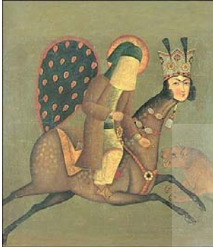
تصویر ۴: نگاره معراج منسوب به لطفعلی خان، قرن ۱۲ق، (دشتگل، ۱۳۸۹: ۸۱)

(براق) در تصاویر معراج حاکی از آن است که هیچ نقطه آن بر روی سطح خاصی استوار نیست و حالت پرش و پرواز را تداعی می‌کند. جز پیامبر ﷺ با روبنده سفید و سربند سبز، براق و شیر، کسی در صحنه وجود ندارد. براق با تاج بلند مرصع، گیسوان موج و چهره‌ای ظریف سه رخ، که تداعی چهره یک موجود مونث را دارد و دمی به شکل طاووس که به مخاطب تصویر می‌نگرد. پیامبر ﷺ با دست چپ، انگشتی را به شیر (که بسیار نزدیک‌تر از دیگر معراج نگاره‌ها تصویر شده) اهدا می‌کند (تصویر ۴).