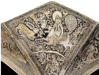
تصویر ۵: آهکبری حمام و کیل منسوب به دوره قاجار

۵. کاشی نگاره تکیه معاون الملک در کرمانشاه مربوط به نیمه اول قرن ۱۴ هجری که در این دیوارنگاره بالاتنه پیامبر در نمای روبه‌رو در حالی که انگشتر را در دست چپ دارد، آن را به جانب شیری غران که در حال جست‌زدن است، پیش برده است. با این‌که پاهای براق بر زمین نیست، ولی حالت پرش و پرواز