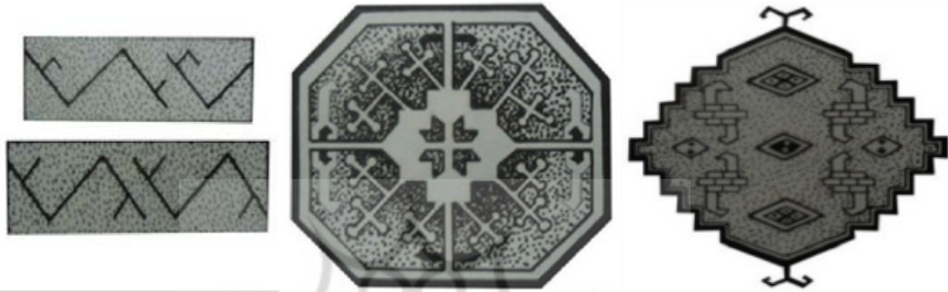
تصاویر ۳ تا ۳: گل ترکمن / گولی گول، گل گل‌دار، سان‌دیک در ترکمن / سینگره (ابرو)، چخماق ترکمن، (حصوری، ۱۳۷۱: ۲۹، ۱۰۷ و ۲۰۲)

گل: یکی از نقش‌مایه‌ها که اکنون در ترکمن دارای بیست شکل مختلف و به ویژه نوع خاصی در هر ایل، طایفه یا حتی تیره است. همان چیزی است که در میان همه ترک‌زبانان به «گول» معروف است و در میان عشایر و روستاییان فارسی، حوض نامیده می‌شود. «گل» ۱ ترکمنی، همان ترنج ایرانی است و در نقشه‌های ترکمن تکرار می‌شود (حصوری، ۱۳۷۱: ۲۹)