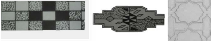
تصاویر ۷ تا ۹: طرح کلی «چووال گل» (Jourdan, 1989: 49) / چووال گل (URL1) / چنتک یا چیتانک، نقوش حاشیه، (URL2)

جایگاهی ویژه دارد (مخبر دزفولی، ۱۳۸۴: ۵۱).