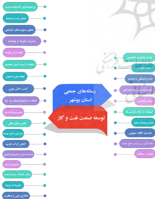
شکل ۱. چارچوب مفهومی اولیه تأثیرگذاری رسانه‌های جمعی بر توسعه صنعت نفت و گاز.

هدف این پژوهش یافتن الگوی مطلوب اثرگذاری رسانه‌های جمعی برای توسعه صنعت نفت و گاز در استان بوشهر، تعیین عوامل واسطه‌ای، بررسی زمینه‌های تأثیرگذاری و ارائه الگوی پارادایمیک تأثیرگذاری رسانه‌های جمعی بر توسعه صنعت نفت و گاز استان بوشهر است. در این راستا باید دیدگاه‌های مدیران و وضعیت مطلوب بررسی و تحلیل شود تا متناسب با آن و با نیازسنجی و در نظر گرفتن