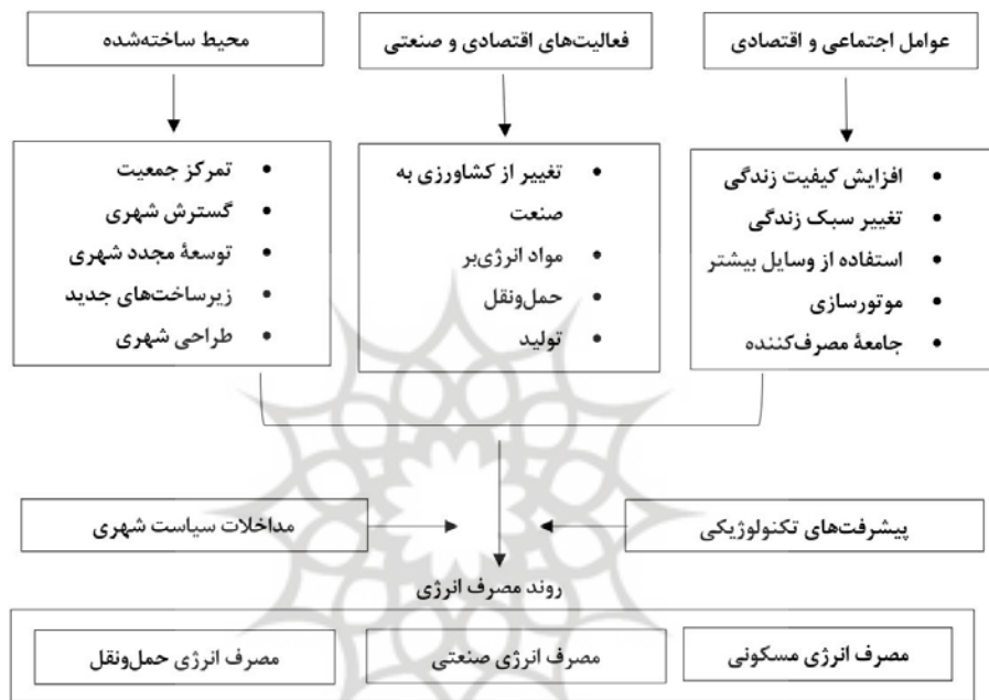
شکل ۱. رابطه نظری بین شهرنشینی و مصرف انرژی

بارتلیت و گاندر رابطه تصادفی بین مصرف انرژی و رشد اقتصادی را با استفاده از هر دو مدل دومتغیره و چندمتغیره مورد بررسی قرار داده‌اند. آن‌ها دریافتند که رشد اقتصادی، اشتغال و مصرف انرژی دارای رابطه همگرایی هستند. نتایج علیت نشان می‌دهد رشد اقتصادی باعث تغییر مصرف انرژی می‌شود و فعالیت اقتصادی تعیین‌کننده افزایش تقاضای انرژی است. آن‌ها با استفاده از تابع تولید نئوکلاسیک نشان دادند موجودی سرمایه نقش مهمی در تعیین جهت رابطه تصادفی بین مصرف انرژی و رشد اقتصادی دارد؛ و تولید ناخالص